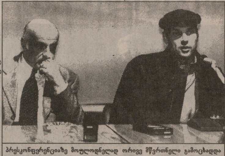
პრესკონფერენციაზე მოულოდნელად ორივე მწვრთნელი გამოცხადდა

— მაღლა ვოსკანოვს არ უთამაშია, მას ფეხი სტკიოდა, მაგრამ მაინც გვესაუბრა. ეს თავად მისი სურვილი გა-