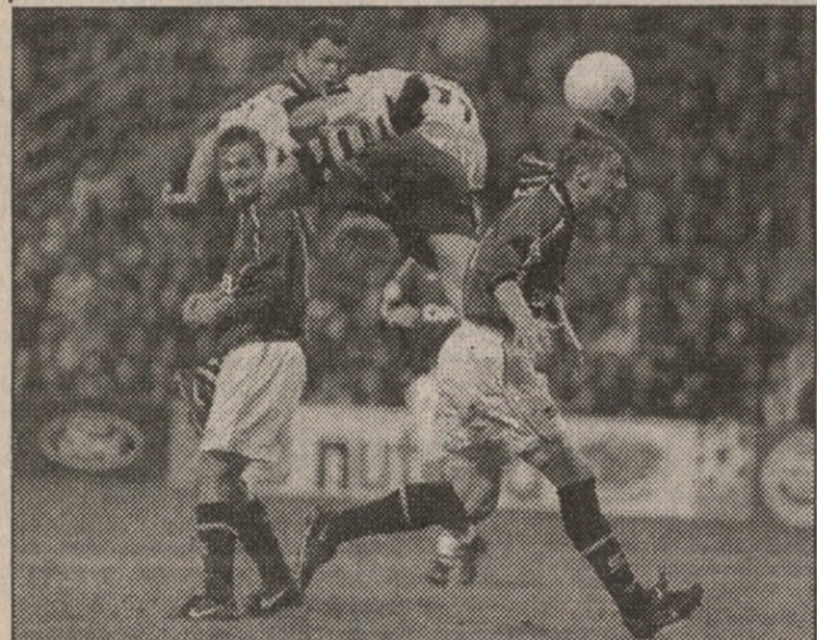
დორტმუნდი — სპარტა. მასპინძლებმა მართლაც იფრინეს...

უაზლოესი მატჩები. 22 ოქტომბერი: მონაკო — ლიფსი, ბავიეთაში — ლევერკუზენი