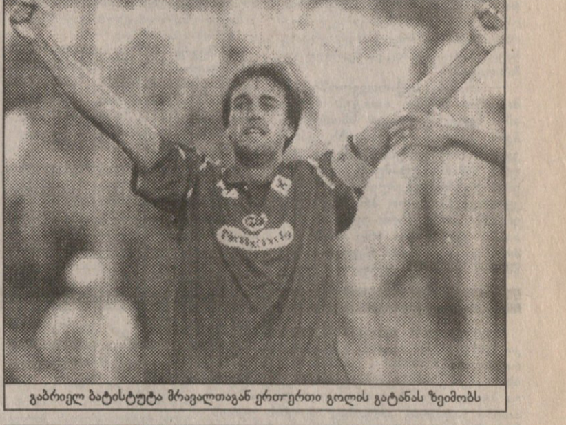
გამბრიელ ბატისტუტა მრავალთაგან ერთ-ერთი გოლის გატანას ზეიმობს

თავდამსხმელები ენრან კრესპო („პარმა“ და არგენტინა) სექტემბერში ხუთი გოლი გაიტანა, მსოფლიოს ჩემპიონატზე არგენტინის გასვლაშიც დიდი წვლილი შეიტანა და საერთოდ — სენსინისთან ერთად ახალ, ნამეტანი ძლიერ დუეტად იქცა. შოთა არველაძე („აიაქსი“ და საქართველო) რა მსოფლიოს ნაკრები ქართველის ვარემე ბოლო-ბოლო, რაც კარგები ვართ „შეიდი გოლი ჩემპიონატში, სამი უეფას თასზე და უსწრაფესით გოლით „აიაქსის“ ისტორიაში მესვლა. ისე, „აიაქსის“ ისტორია პარტიკული ხომ არ გვინიბთ? გამბრიელ ბატისტუტა („ფორინტინა“ და არგენტინა) ვკონებთ, კიდევ არავინებულ მოგვიწევს ჩვენს ნაკრებში მისთვის ადგილის გამოჩენაო, ვწერდით წინა ვერზე ვერჯერობით, ჩვენც და გამბრიელიც სიტყვას ვასრულებთ, ამ ნომრის ერთ ეგზემლარს კი, ალბათ, დანეილ პასარელასაც ვაუკუზუნით.