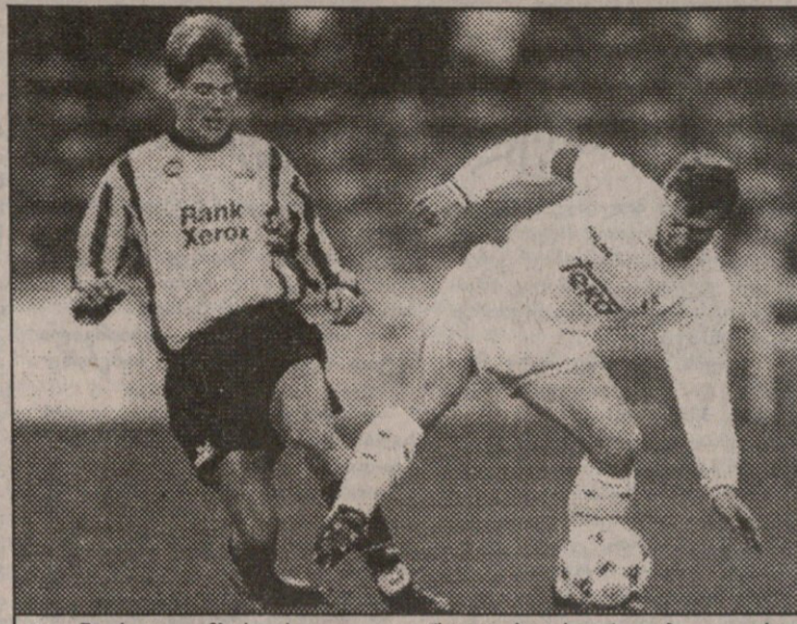
1994 წლის 6 დეკემბერი, რეალი — ოდენსე 0:2. ბუტრაგენია აბაოღა გირვა