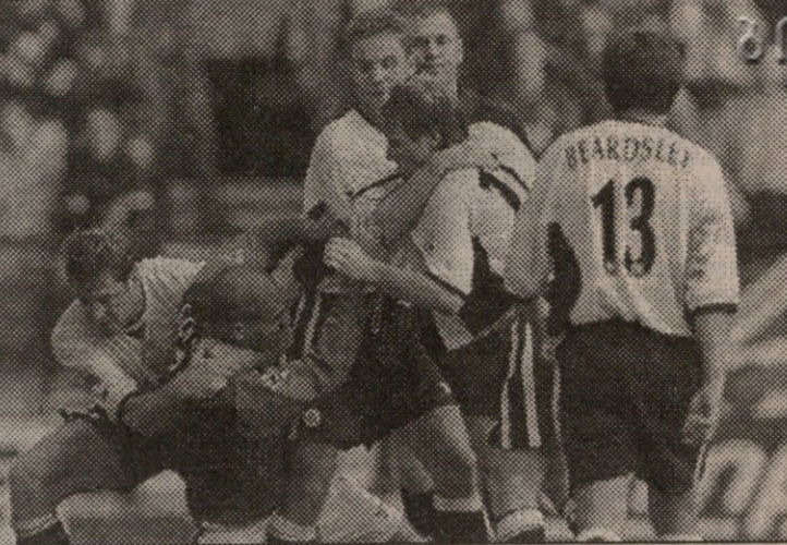
კოლიმორმა ამჟერადიც ვერ გაიტანა და ერთ-ორიკ მოხვდა

ცხადია, უფრო უფროსი მოტყუება არ უტყვის — ეს ამითი დარი გოლი კიდევ ერთხელ იხილა მაყურებელმა, როცა თავის მოედანზე ჩარჩენილმა მაკმანამანმა ორმოცმეტრიანი პასით ერთხელ ბერგერი და რიდელე დატოვა დე გუსისთან „სალაპარაკოდ“ და ჩეხმა პირველი ლივერპულიერი ჰეთ-თრიქი გაახერხა. ეს 57-ე წუთზე მოხდა და „ჩელსის“ მარცხი ცხადი გახდა — 3:1.