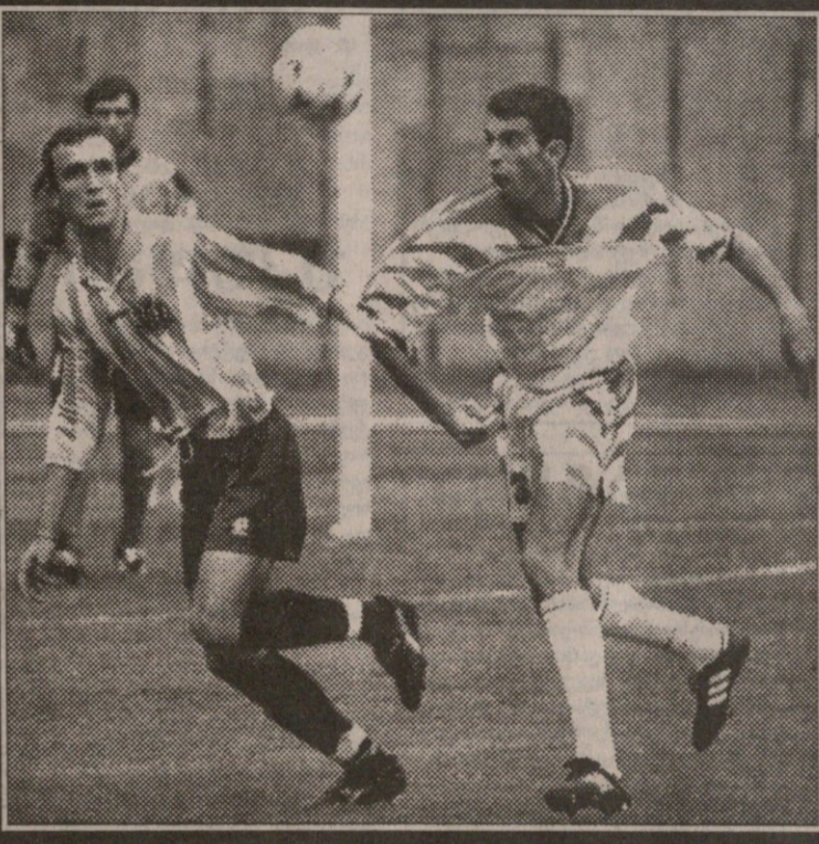
გუშინ ეროვნულზე: „დინამო“ — „კოლხეთი“ პირველი გოლის გამტან ალექსიძეს ამჯერად ქუტიმემ (№3) დაასწრო სხვა მატჩების რეპორტაჟები იხილეთ მეორე გვერდზე