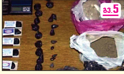
ნაკოდანაგაულისთვის 3 პირი დააკავეს

„ეს აღგანს საუიპ პრესულენს“ სახელმწიფო ინსპექტორის სამსახური საქალაქო სასამართლოს წინააღმდეგ