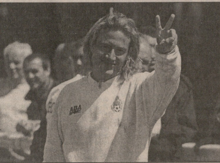
ერნანდესის თამაშით ევროპული კლუბებიც მოიხიბლნენ

შთაბეჭდები გამარჯვების შემდეგ მექსიკაში უკვე ალაპარაკდნენ ზოგიერთი ფეხბურთელის ევროპაში შესაძლო გადასვლაზე. ყურადღების ცენტრში ძირითადად კორეელთა კარში ორი გოლის გამტანი ლუის ერთანდესია მოქცეული. ქერა თავდამსხმელი, ალბათ, წინააღმდეგი არ გახლავთ, მის ირგვლივ ატეხილი მითქმა-მოთქმა რომ ჩაცხრეს, და თუ რეალური შესაძლებლობა ექნა, მომავალი სეზონი დიდი საიმპოვნით გადაბარდება ბებერ კონტინენტზე.