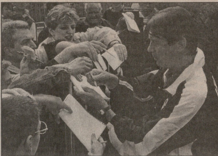
ჩეხარე მალდინის სიფრთხილ სალაპარაკო გაუხდა... თუმცა ჩერ ავტოგრაფების მსურველნი არ აყლია

ვისა ნათქვამი ამას ბავშვები მიხვდნენ. აბა, რომელ ფეხბურთელს არ სურს ნაკრებში თამაში. მწვრთნელის გადაწყვეტილების გამო ბევრ მოთამაშეს გაუფუჭება ერთმანეთთან ურთიერთობა. მართალია, რობერტო ბაჯოს და ალესანდრო დელ პიეროს შორის შუღლი არ ჩამოვარდნილა, მაგრამ ამის საკმაოდ სერიოზული წინაპირობა რომ არსებობს, ფაქტია. ისე კი ყველაზე არასასურველი, რაც ახლა იქნებოდა „სკუადრა აძურასთვის“ ეს ფეხბურთელთა შორის შეუღლია — ასეთ დროს, პირიქით, ერთ მუშტად შეკრა და ერთმანეთის გამხეცება საჭირო.