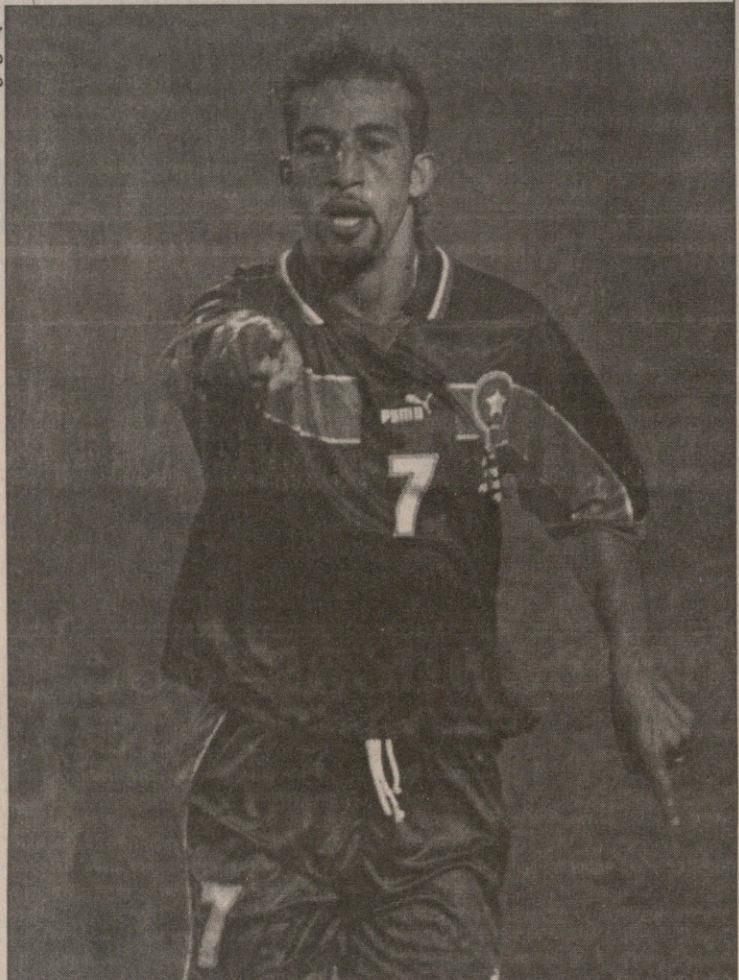
მუსტაფა პაჯი — ყველაზე დიდი პატარებს შორის

ბოლო ოცდაათ წელიწადს საქმე ისე აეწყო, რომ სენსაციებს აფრთხილები გვთავაზობდნენ. გამოჩენილი კი არაბულ აფრიკის შედეგები. ეს არაბული აფრიკა დიდად გაამწარებდა ხოლმე გერმანელებს. ჯერ იყო და მსოფლიო ჩემპიონატების პირველმა არაბულმა გუნდმა, ტუნისმა გაუგორა ფრე ჩემპიონებს 1978 წელს, ოთხი წლის შემდეგ კი ალჟირის ნაკრებმა საერთოდაც დამარცხა გერმანელები. 1986 წელს, მექსიკაში, მაროკოს ნაკრები პირველად აღიღეს ისე გაგიდა თავის ჯგუფში, რომ უკან მოითოვა ინგლისი, პოლო-