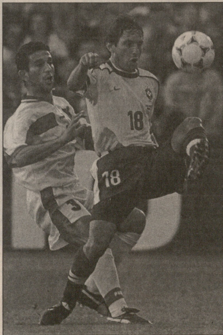
ელ ჰადრიუსი და ლეონარდოს (18) ორთაბრძოლებში უმეტესწილად ბრაზილიელი ნახევარმცველი იმარჯვებდა

მარიო ზაბალო, ბრაზილიის ნაკრების მთავარი მწვრთნელი: ჩვენ გაცილებით უკეთ ვითამაშეთ, ვიდრე გახსნის მატჩში შოტლანდიასთან. ამ შეხვედრაში აუცილებლად გვჭირდება