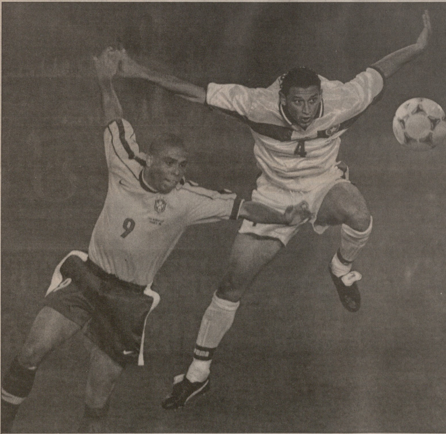
დაზაფრული მაროკოელები თუკი ვინმეს უფრთხოდნენ და „დაჰანკალებდნენ“, ცხადია, მსოფლიოს საუკეთესო ფეხბურთელ რონალდოს