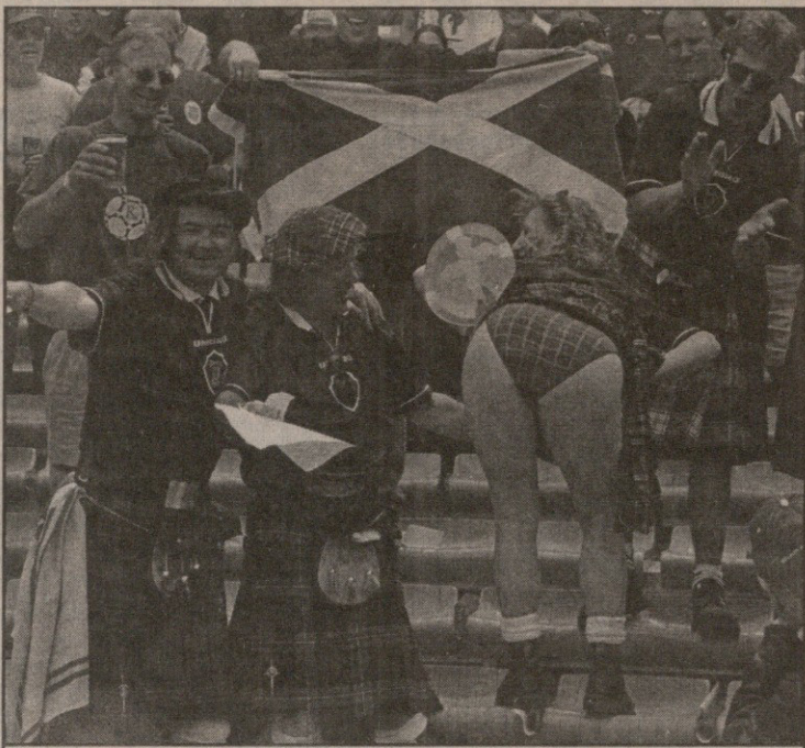
არავის გაუკვირდეს, შოტლანდიელი გულშემატკივრებისთვის, სქესის განურჩევლად, კაბის წამოხდა ჩვეულებრივი ამბავია

ბორდოს მერიამ მარსელელი კოლეგების გამოცდილება ვერ გაითვალისწინა და ლუდის გაყიდვა ქალაქში არ აკრძალა. შედეგად ის მიიღო, რომ ეროვნულ კაბეში გამოწყობილმა და საგრძნობლად შეზარსოვებულმა გულშემატკივრებმა ნორვეგიელ ვიკინგებს რომ ჰკიდეს თვალი, მყისიერად გამხდნენ, ბოლმა ყელში