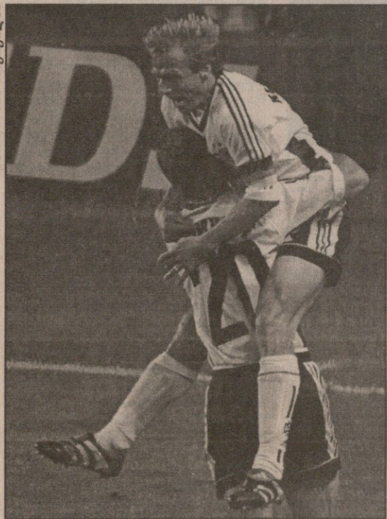
იურგენ კლინსმანი ოლივერ ბირპოვს შეტემაში. ზოგჯერ პირიქითაც ხდება

ეს ორი ჩილეელი ალბათ ბევრ გუნდს გაამწარებს, თუმცა ისიც საეჭვოა, ჩილეს ნაკრები მეთხედფინალში გავიდეს რაც არ უნდა იყოს, მსოფლიოს ჩემპიონატი გუნდური ტურნირია. ორი მოთამაშე კი, თუნდაც უძლიერესი, რომელც ნორმალურ ფეხბურთელთან ვერაფერს გახდება.