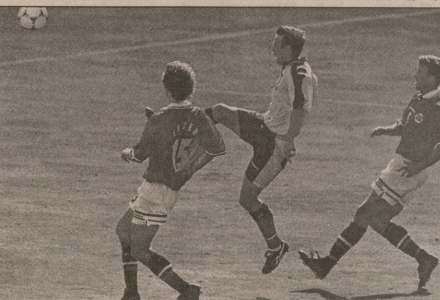
კრეიგ ბარლი ორ ნორვეგიელ მცველს დაუსხლტა და აბრაგანით გაათანაბრა

საბოლოოდ მხოლოდ იმის თქმა მიწია, რომ ჩვენი ჩამოწერა ჯერ კიდევ ადრეა. შოტლანდიის მერვედფინალში გასვლის შანსი არ დაუკარგავს და თავის სიტყვას მაინც იტყვის. ვფიქრობ, ბრაზილიელები შემდეგ წრეში გასვლას დღესვე განაღდებენ და ამიტომ მთავარი ბრძოლა დანარჩენ სამ გუნდს შორის გაჩაღდება.