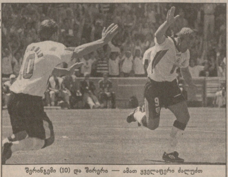
შერინგემი (10) და შირერი — ამით ყველაფერი ძალუძო

ბოლო ორი წელია, ბუნდესნაკრებში თავდასხმის ბრწყინვალე წყვილი შეიქმნა — იურგენ კლინსმანი და ოლივერ ბირპოვი შესანიშნავად უეებენ ერთმანეთს, მეტიც ბრწყინვალედ. მათ შორის ასაკში განსხვავება თითქმის ათი წელია. გერმანელთა კაპიტანი გამოცდილებითაც აშკარად ჯანის ახალგაზრდა პარტნიორს, თუმცა ეს თამაშისას სულაც არ იგრძნობა. მოედანზე ორივე ფორვარდი თანაბარი, მაგრამ ამავე დროს უმაღლეს