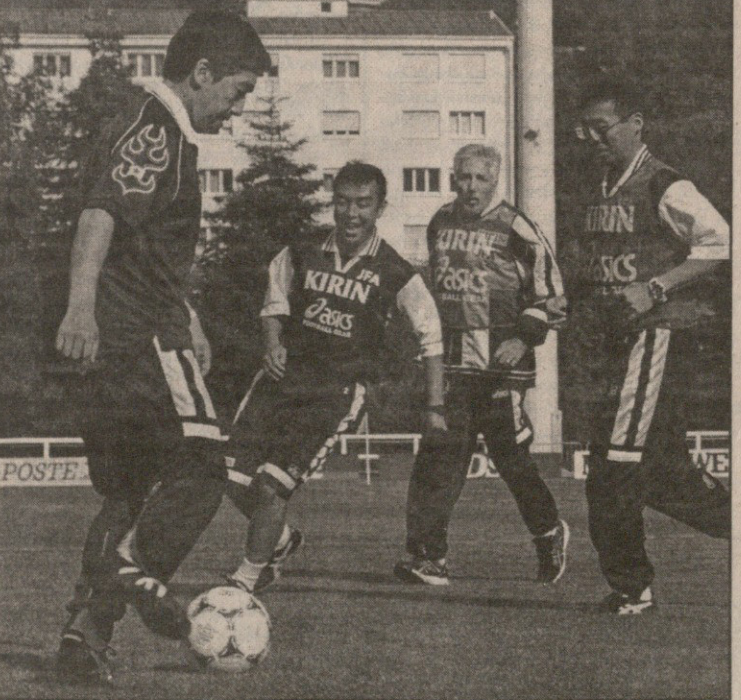
იაპონიის მეფისწული ფაკამადო (მარცხენი) ძეყენის ნაბრძეს ესტუმრა და მწვინთელომთან იმუბთავა კიდეს