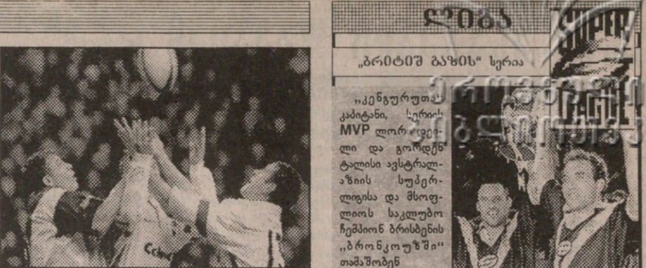
ნაწიადრე ბლომად იყო აბრავანი თუ ტაქტიკური დარტყმა, იქნებ შეტოკებს სველი ბურთი გაუვარდესო

„ბრიტში ბაზის“ სერია „იკენგურუთა“ კაბიტანი, სერიის MVP ლორდერილი და გორდენ-ტალოსი ავსტრალიის სუპერ-ლიგის და მსოფლიოს საკლუბო ჩემპიონ ბრისტონის „ბრონკო უაი“ თამაშობენ ტესტი. 15.11. ლიფსი. ელანდ როუდი: ბრისტონი 20 (2) (3 ლელო: პოუტონი 2, რობინსონი; 4 გოლი: ფარული) — ავსტრალია 37 (25) (7ლ: სელიორი 2, ნაგასი, დევილი, თორნი, სმიტი, კერნსი; 4გ: გერდლერი; ფილდ-გოლი: ლოკიარი) (39 თასი მყურებელი). სერიის 1-2