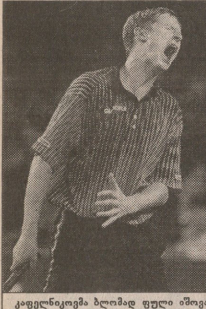
კაფელნიკოვმა ბლომად ფული იშოვა

ქსირდა. კაფელნიკოვს ფინალში გასვლისთვის მიღებული 640 ათასი დოლარი და კლასიფიკაციაში წლის ბოლოსთვის მეექვსედან მეხუთე ადგილზე ანაცვლება დარჩება ნუგეზად რაც შეეხება სამპრასს, იგი ტურნირის შემდეგ მილიონ 340 ათასით გამოიდრდა, საერთო მონაგრით კი 30 მილიონ დოლარს გასცდა.