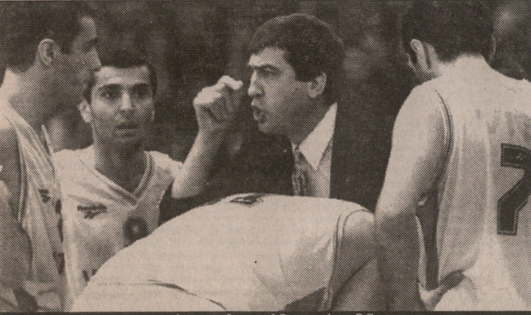
დღეს უკეთ უნდა ვითამაშოთ, ვიდრე გუშინ!

26 ნოემბერს კალთბურთელთა ევროპის ჩემპიონატის შესარჩევი ტურნირი იწყება