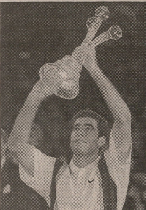
პიტ სამპრასი მსოფლიოს ჩემპიონია

პანოვერი. ATP-ის მსოფლიოს ჩემპიონატი. ტარდება დარბაზში პარდზე. საპრიზო ფონდი 3,6 მილიონი დოლარი.