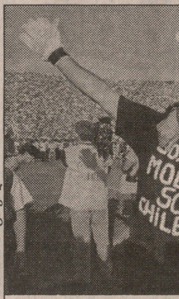
ჩილეტა მეკარე ტაბია და მწვრთნელი აკოსტა მეცხრე ცაზე არიან

16 ნოემბრის დამეს ჩილეში არავის დაუძინია. ეს სულაც არაა გასაკვირი — ზუსტად 15 წლის შემდეგ ქვეყნის პირველი გუნდი მსოფლიოს ჩემპიონატზე გაეგია. დიდხანს, ოცნებობდნენ ჩილელები უპირველეს საფეხბურთო ტურნირზე მოხვედრაზე, მაგრამ ესპანეთში ჩატარებული მსოფლიოს ჩემპიონატიდან