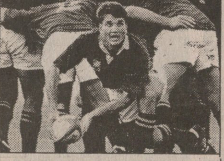
ნამატრეპს აფრიკელთა კაბიტანმა ვარი ტაიბანმა შეინიშნა, მატჩი ფრიადო ტესტი იყო; ორმა ფრიადამ ტესტი-გუნდმა სასწაულად იომა და იბურთავაო.

88 კეპის ბატონი, 26 წლის ოუსტ ფანდერვესტიონ-იზენისთვის ეს ტურნე დასრულდა საზარდოდ დაშავებული კვირას შინ გააფრინეს