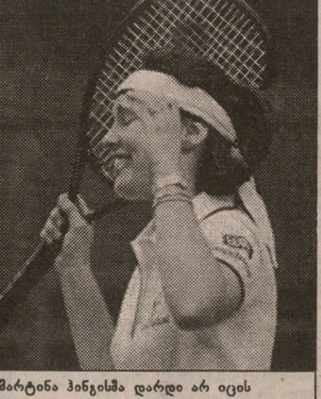
მარტინა პინგისმა დარდი არ იცის