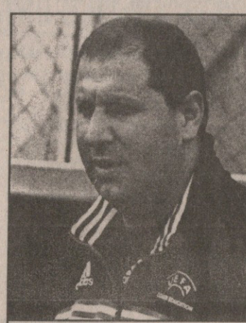
დარსაძე წყალტუბოსკენ იხედება