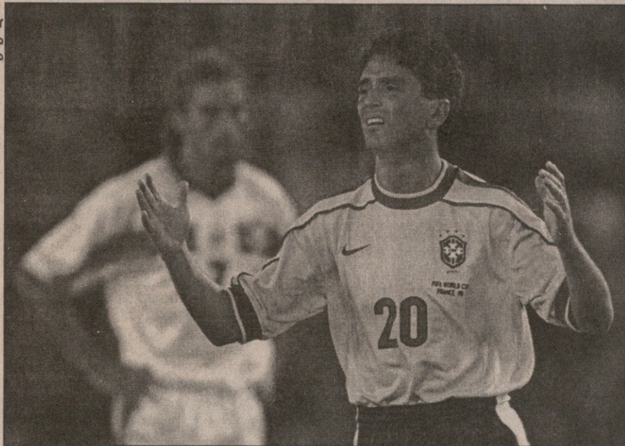
არტუო სასურველი, მაგრამ გარდაუვალია — ბებეტოსთვის ეს უკანასკნელი მსოფლიოს ჩემპიონატია