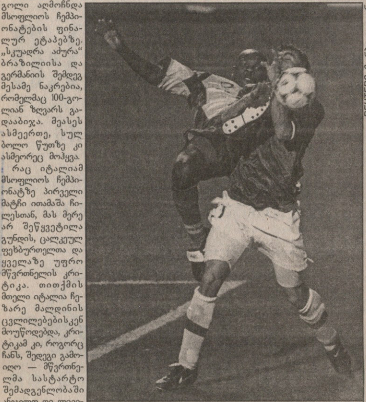
ორი გოლის გამტან ვიერის რომ არ ემარჯვა, ვიერი ნაღდად თავს წააცლიდა