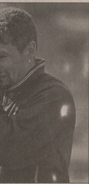
რობერტო ბაჯოს ბრინჯაოსა და ვერცხლის მედლების შემდეგ ოქროს მოპოვება სწაია