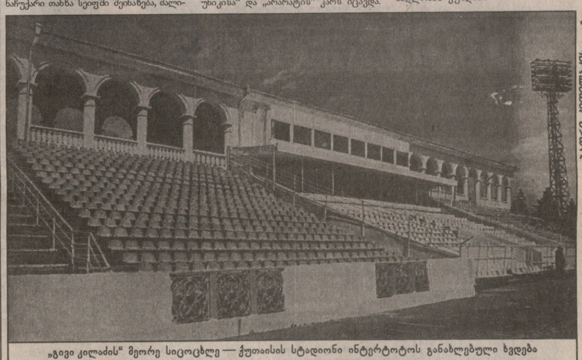
„გივი კილაძის“ მეორე სიციხლე — ქუთაისის სტადიონი ინტერტოტოს განახლებული ხედვა