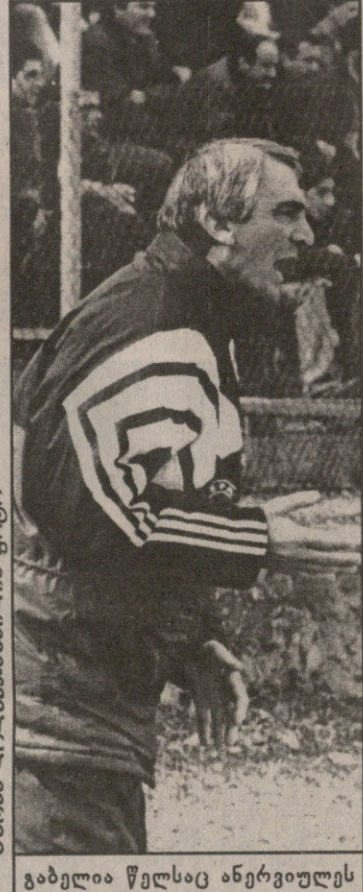
გაბელა წელსაც ანერგიულს