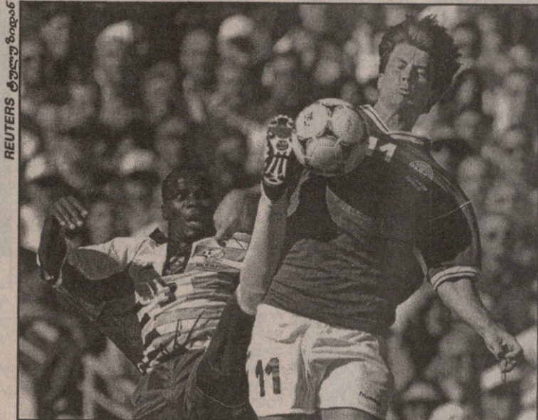
ბრიან ლაუდრუპის (№11) ძალისხმევა გამარჯვების მომტანი არ აღმოჩნდა