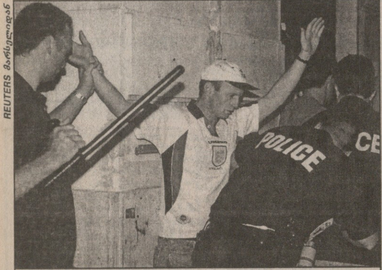
ყურადღება, ბრიტანელები! ფრანგული პოლიცია ფხიზლობს

— იცი, ახლა ვის ელაპარაკები? მე, ერთ-ერთი ყველაზე საშიში სულიერი ვარ მთელ ბრიტანეთში — ახალგაზრდა კაცი თავის მობილურ ტელეფონს დახვალხვ დებს და რამდენიმე სიტყვას ისე გამყინავად გამოცხადებს კბილებში, რომ საბრალლო ბარის მფლობელის ფეხები უკანკალებს და გულისფეთქვა უჩერდება. ამგვარ სიტუაციას ამ დღეებში საუბარად ხშირად შევსწრებით საფრანგეთში. მსოფლიოს ჩემპიონატის დაწყების პირველივე დღიდან ათასი