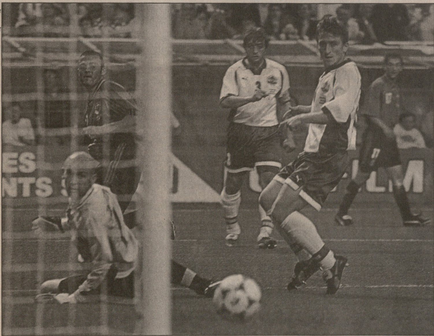
ბულგარელთა დაცვა და მეკარე ესპანელთაგან საუკეთესო ლუის ენრიკეს დარტყმულს გასცქერის, მაგრამ ეს გოლიც ისევე ამაოა, როგორც დანარჩენი ხუთი