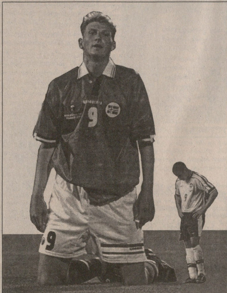
ბოროტი საერთაშორისო ხუმრობა: ვინ უფრო სასარგებლოა თავისი გუნდისთვის, ჩელსის ან დუბლინის ფლო თუ მსოფლიოში საუკეთესო რონალდო?

რთულად მორაგებებს გვიან. თამაშობენ ანბანივით გასაგებ ფეხბურთს.