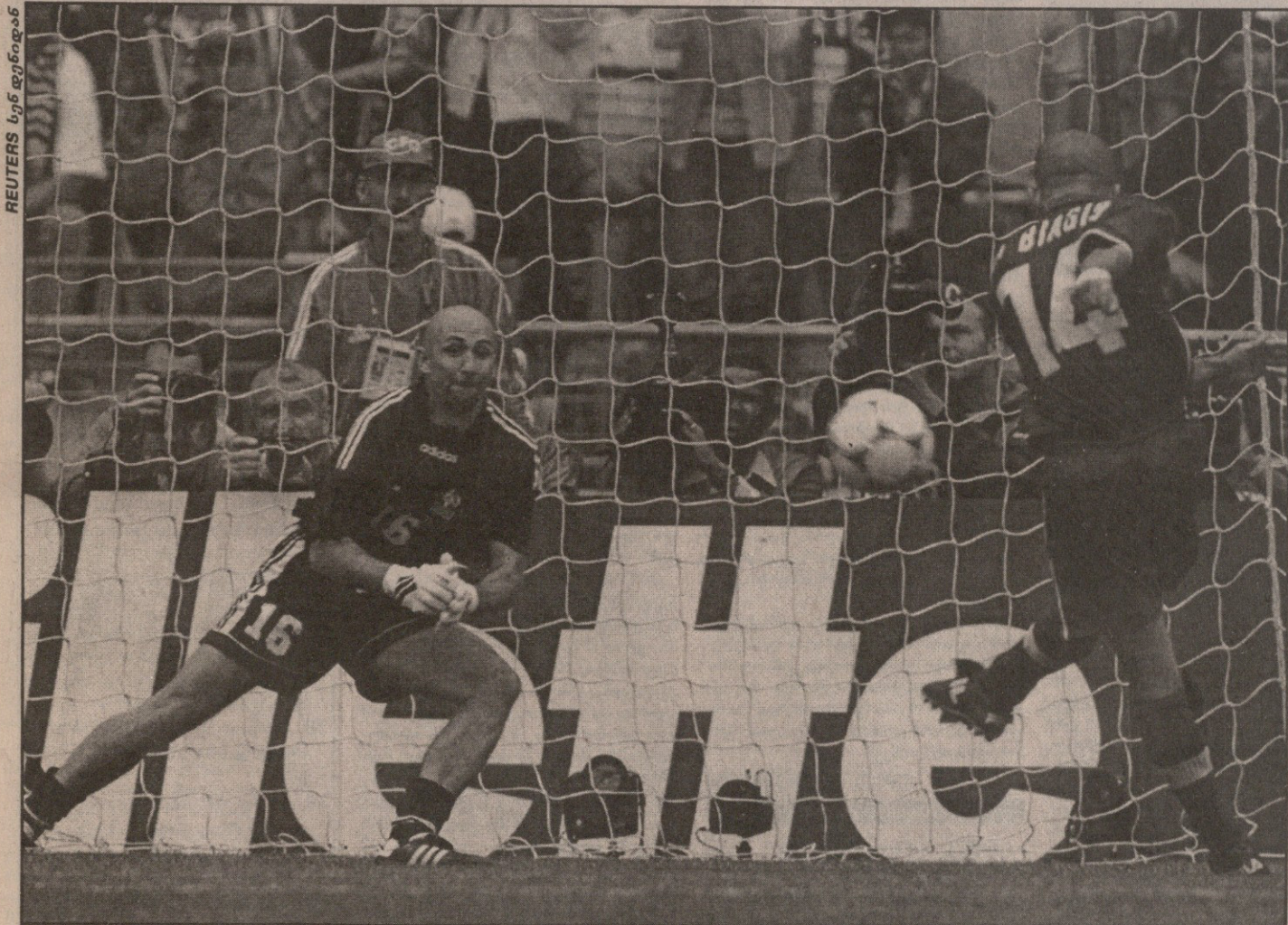
სენ დენიდან