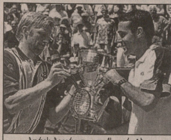
ბორის ბეკერი და ალექს კორეტბა

გმტაადი. შვეიცარიის ღია პირველობა. ტარდება თინხარზე. საპრიზო 550 ათასი $