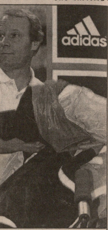
ფოგთსმა ბლატერთან უბრაოდ ყოფნას ისევ ბოდიშის მოხდა არჩია