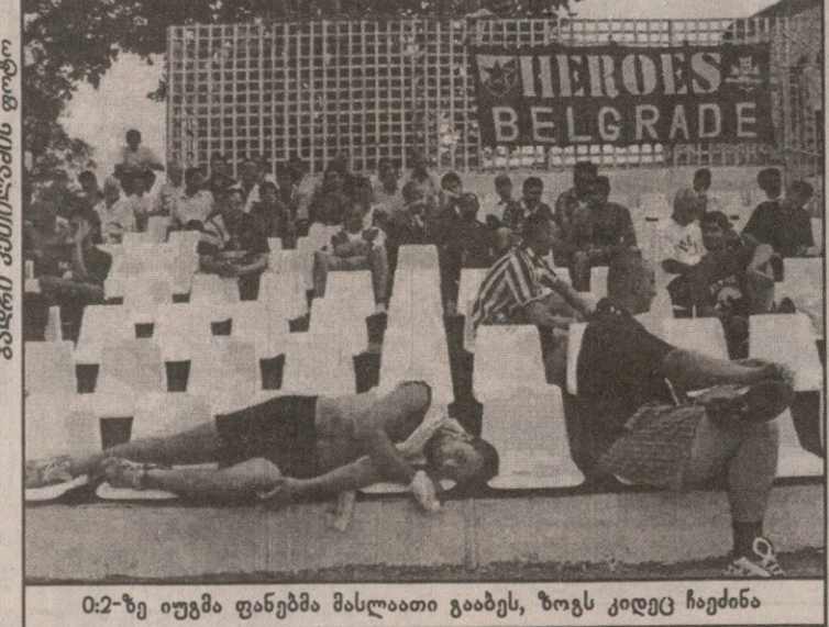
0:2-ზე იუგმა ფანებმა მისლაათი გააბეს, ზოგს კიდევ ჩაეძინა