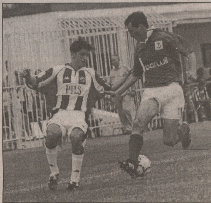
ოგნიენოვიჩის, რომ დაგვიბრდა, თუ შესაძლებლობა მექნა გავიტანო, კოლხი ჭობულაძე კი მეურვეობდა, მაგრამ მონასტერი რომ აირია, შემეშა

მატჩების რეპორტაჟები იხილეთ მეორე გვერდზე