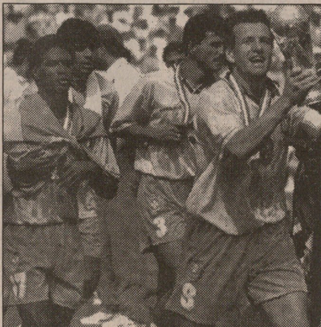
1994 წელს ბრაზილიელეები ჩემპიონობას ზეიმობენ