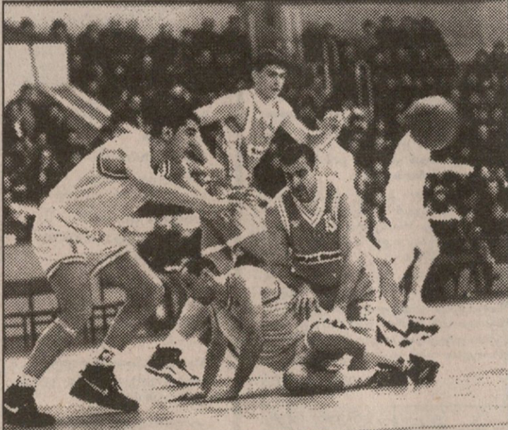
ქართველი და ოსმალნი ბურთისთვის იბრძვიან

სამქულიან სროლებზე გადაიტანეს აქცენტი და ამიტომაც იყო, ენე და ერდენაი, ჩვენთან განსხვავებით, ღიადანს რომ ეძებდნენ გზებს მასპინძელთა ფარისკენ.