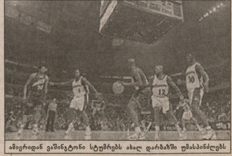
ამიერიდან ვაშინგტონი სტუმრებს ახალ დარბაზში უმასპინძლებს