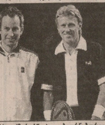
ჯონ მაკინროი (მარცხნივ) და ბიორნ ბორგი

ATP-ის ვეტერანთა ლიგა, რომელიც თავის ტურნირებს რეგულარულად მართავს, ჩოგბურთის მოყვარულთა ახალ თაობას გასული წლების დიდი ჩემპიონების ხილვის შანსს აძლევს. ვეტერანი მთამაშებები ხშირად თავის უმცროს კოლეგებზე სასერიო სანახაობას მართავენ, თუმცა მათი შესაძლებლობისგან გამომდინარე, მესამე სეტში მაგივრად ე.წ. საჩემპიონო ტაი-ბრეიკი იმართება, რომელშიც ჩვეული 7-ის ნაცვლად მოსაგებად 10 ქულის დაგროვება საჭირო. წინასწარ შეხვედრებში ერთი, უდავოდ ყველაზე საინტერესო მატჩი გაიმართა — დიდი სლემის ტურნირების 11-ჯერ გამარჯვებული შვედი ბიორნ ბორგი უიმბლდონის სამეზბო ჩემპიონ ჯონ მაკინროის გადაეყარა. ამათი უკანასკნელი შეხვედრა ინგლისში 1981 წელს, უიმბლდონის ფინალში შედგა. მაშინ ამერიკელმა მეტოქეს ყველაზე პრესტიჟული პირველობის ზედიზედ მეექვსედ მოგება არ დაანება. ამჯერად 41 წლის ბორგი პირველ ხელში იმარჯვა, 38 წლის მაკინროიმ — მეორეში. საჩემპიონო ტაი-ბრეიკზე „როიალ ალბერტ პალის“ გადამწყვეტი ტრიბუნები მეული დროის დარი გათამაშებების მომსწრენი გახდნენ, გამარჯვება კი მაკინროის დარჩა — 10:7. ამერიკელმა მატჩის განმავლობაში ძველბურთა თამაშთან ერთად ჩვეული ხასიათიც გამოავლინა — მსაჯებმა მაკინროე სიტყვებით შეამკო, თუმცა, პრესკონფერენციაზე განაცხადა, რა ექნა, კონტრაქტი მაუალღებულებს.