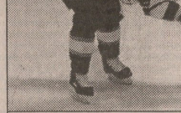
ბალეტი ყინულზე: ლოსანჯელისელებმა შტუმპელებმა ტორონტოელი კოროლიოვი აცვეკა

მართალია, სტუმრებმა გასწეს ანგარიში, მაგრამ მერე ინიციატივა მთლიანად კანადელთა მხარეს გადავიდა და „ფოთლებმა“ მანამ არ მოიხვეწეს, სანამ განდგურებამდე არ მიიყვანეს საქმე. გამოსარჩევი სუნდინის სამეულთა — შედსა და გამოცდილ კოროლიოვს (3 პასი) პირველად შეუამხანავეს ახალბედა ჯონსონი (1+2,0). „მეფეებმა“ კი თავიანთი ჩრდილო-აღმოსავლური ვიიაჟი სრული კრახით დაასრულეს (3 მარცხი და შიბების სავალალო ბალანსი 4:12).