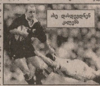
ასე დასდევდნენ კალენს

დღის, თამაშის ბოლოს წინ უკვე სტუმრები იყვნენ. მათ ამას თანდათან, მეთოდურად მიაღწიეს. ინგლისის სასტარტო ბლიცა დალადა. თამაშის ბო- ლო საათი თითქმის სულ ზე- ლანდია უტეკდა, მაგრამ პომეში მაინც მაგრად იდგნენ. ლომუსი უკვე ვიქვით. ბანსი და ლიტლი ზედმეტად აფერხებდნენ ბურთს, ვილსონი საერთოდ არ ჩანდა, მერტენსის წინა ორი ნახში თავდასრული მუშაკობა, მარბიელი კრონფელდი კი მეტოქეს იერიშიში აა- ცილა ხოლმე ბურთს. შესვენებამდე მერტენსმა ორი გოლი შეაგდო 20:9. ამამდე დალალიომ (!) ლელლოდან ფეხით ორჯერ მო-