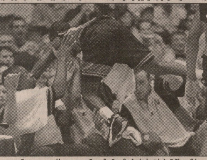
კლივლენდი — ლეიკარსი. კლივლენდმა ნაითმა ბურთს ტრიაუნებზე მისცა

5 დეკემბერი ჩიპაბო 84:62 მილუოკი ჩიპაბო: კუკონი (19), ლონგლი (16) მილუოკი: გილიამი (18+13 მოხსნა) ჩიკაგომ იოლად სძლია მილუოკი ბაქსს, ვისთვისაც 62 ქულა ყველაზე უარესი შედეგია ბოლო 30 წლის მანძილზე. მილუოკელები თავიდანვე გატყდნენ, პირველი მეოთხედი 13 ქულით წააგეს, მეორე მეოთხედი ცოტა კი მოციოხლდნენ, მაგრამ მერე ისევ ძველებურად გაუტყეს და მეორე ნახევარში სულ 26 ქულას გამოიჩინეს. მაიკლ ჯორდანმა სეზონში ყველაზე ცოტა — 13 ქულა დააგროვა. ნიუ ჯერსი 107:88 ფილადელფია ნიუ ჯერსი: გილი (24), უილიამსი (20+11 მოხსნა) ფილადელფია: კამინგსი (16+11 მოხსნა) ამ თამაშში, როგორც იქნა, გამოჩნდა დრაფტში მეორე ნომრად არჩეული ნიუ ჯერსის იმედი კიტ ვან პორნი, თუმცა დებუტანტმა ბევრი ვერაფრით გამოიჩინა. ორლანდო: საიკლი (29+11 მოხსნა) გოლდენ სტიტის ლიდერს ლატრელ სპრიუელს, მოგესვენებათ, ძვირად დაუჯდა მწერტინელის გაღება — NBA-ს ერთი წლით გამოათხოვეს, მაგრამ მის გარეშე დარჩენილმა მეომრებმა მინც იუ-საკცეს და მეორედ გაიმარჯვეს. ორლანდოს თავისი ყოჩა პენი პარდვევი აკლდა. მანაჰუაინი 98:107 კლივლენდი ვანჯუფერი: აბდურ-რაჰიმი (27) კლივლენდი: პერსონი (30), კემბი (25+11 მოხსნა) კლივლენდმა კანადელებთან გამარჯვებით შეიღამე გაზარდა წაუტეველი მატჩების სერია. ლეიკარსი 98:88 სან ანტონიო ლეიკარსი: ვან ექსელი (25), კემბეული (21) სან ანტონიო: რობინსონი (19+10 მოხსნა), დანკანი (18) ლეიკარსმა დაამტკიცა, რომ შაკილ ონილის გარეშე უძლიერესთაგანია. ახლა