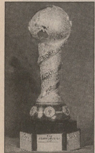
მეფე ფახრის თასი

მოგესხენებათ, დღესდღეობით მსოფლიო ფეხბურთში, განსაკუთრებით კი ბტერ კონტინენტზე, დიდძალი ფული