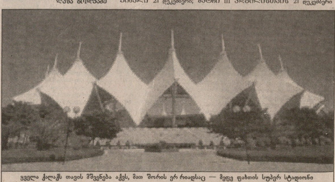
ყველა ქალაქს თავის მშვენიერება აქვს, მათ შორის ერ რიადსაც — მეფე ფახრის სუბერ სტადიონი

კლუბებს მთამაშეთა გაშვება არ უნდათ, ნაკრებს კი უფლებდობა თამაში. სიტუაციიდან თავის დასაღწევად ფიფამ გარკვეული წესები დააღიგა, თუმცა ვადაწვეტილებას კლუბების ხელმძღვანელობა მაინცდამაინც არ აღფრთოვანებია. ხვალ საუდის არაბეთში კონფედერაციების თასის მორიგი, მესამე გათამაშება იწყება. თავად არაბები ამ ტურნირის, ინიციატორის პატივსაცემად მეფე ფახრის თასის გათამაშებასაც ეახიან. ათიდან ტურნირში მონაწილე რვა ქვეყნის ნაკრებების წამყვანი მთამაშეები საზღვარგარეთ თამაშობენ, აქ კი ზემოხსენებული პრობლემა წამოიჭრა — კლუბებს მთამაშეთა გაშვება არ უნდათ, ნაკრებებში კი დღევინიერი თამაშე აუცილებელია. მარსელში გამართული სხდომაზე სწორედ ამ საკითხს მიემდინა. იტალიის, ესპანეთის და ბრაზილიის წარმომადგენლები კი იმაზე ბჭობდნენ, რომ კლუბებს ფეხბურთელების ათი დღით დაკარგვა არ სთამოვნებთ.