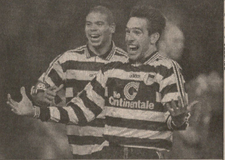
მეტრა — კაიზერი. პრეტვი და დინცი ლიდერის ძღვეას ხარობენ

ამ გამარჯვებამ წინა სამი შეხვედრით გამოწვეული იმედგაცრუება სადღაც მოისროლა. ვგონებ, იგი ისევე ფრე იყო იქნებოდა. ასეთი წარმატება, რაც სეზონი დაიწყო, თითზე ჩამოსათვლელი გვექონდა, ამიტომაც იგი უდიდეს სიამოვნებას გვანიჭებს — განაცხადა „მარსელის“ მწვრთნელმა როლანდ კურბისმა. საქმე ის ვახლავთ, რომ „მარსელმა“ ხსენებული სამი თამაშის გამო ლიდერობა სხვებს დაუთმო, მაგრამ „ლანსთან“ მიღწეული გამარჯვებით ყველას შეახსენა, რომ ჯერ კიდევ სერიოზული ზრახვანი აქვს. ყოველთვის ვამბობდი, რომ ჩვენი მიზანი ხუთეულში ადგილის მოპოვებაა, მაგრამ არასდროს დამიზუსტებია კონკრეტულად რომელი ადგილი დავკმაყოფილებ, თუ ჩემპიონები გავხდით,