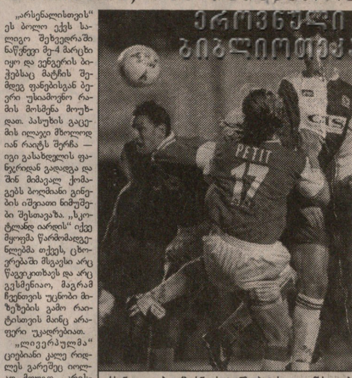
არსენალი — ბლექბერნი. სატონმა პეტის და ადამსს აჯობა

„არსენალისთვის“ ეს ბოლო ექვს სალიგო შეხვედრაში ნაწილად მე-4 მარცხი იყო და ვენგერის ბიჭებსაც მატჩის შემდეგ ფანებისგან ბევრი უსამართლო რამის მოსმენა მოუხდათ. პასუხის გაცემის ილაჯი მხოლოდ იან რაიტს შერჩა — იგი გასახდელის ფანგრიდან გადადგა და შინ მიმავალ ქომაგებს ბოლმანი ვინგბის იშვიათი ნიმუში ბი შეესაფარა. „სკოტლანდ არის“ იქვე მყოფმა წარმომადგენლებმა თქვეს ცხორებაში მსგავსი არც წავიკითხავს და არც გესმენიაო, მაგრამ ჩვენთვის უცნობი მიზეზების გამო რაიტისთვის მაინც არაფერი უკადრებიათ. „ლივერპულმა“ ციებიანი კალე რიდელს გარეშე იოლად მოუგო „კრისტალს“ და ამ კოლუმს ისევ გადაუწყვეტელ ამოცანად დაუტოვა პირველი სამიზო მოგების საქმე. „ვესტ ჰემის“ სამთვინი იძულებითი შესვენებიდან მობრუნებულმა პოლ კიტსონმა „შევილდ უენსდეს“ 4-მატჩიანი მომგებიანი სერია შეაწყვეტინა, ხოლო „საუთჰემპტონმა“ „ლიესტერს“ 2:1 ძლიერი ასევე 4-მატჩიანი, ოლონდ მოუგებელი სერია შეწყვიტა. ქოვენთონში კვლავ განგრძობ თავისი უხვიო სელა „ტოტენჰემმა“. ამ მატჩში მასპინძელთა რიგებში ორკვირიანი შესვენების შემდეგ გამოჩნდა „ქოვენთონისა“ და სკოთთა ნაკრების 32 წლის კაპიტანი გარი მაკალისტერი, თუმცა, ალბათ, სჯობდა, მას კიდევ ცოტა ხანს შეეცადა — 32-ე წუთზე მან მუხლის ტრავმა გაითმეზა და ახლა იანერის ბოლომდე ვეღარ ითამაშებს. „მას ძლიერ მამაცი გული აქვს, მაგრამ ამ გულს კიდევ 6 კვირა აღარ მოუწევს აჩქარებით ცემა“ — დანებებით შენიშნა გორდონ სტრანანმა.