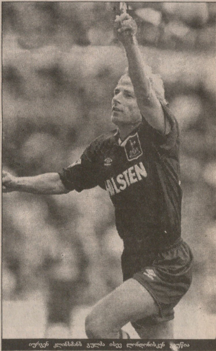
იურგენ კლინსმანს გულმა ისევ ლონდონისკენ გუწია