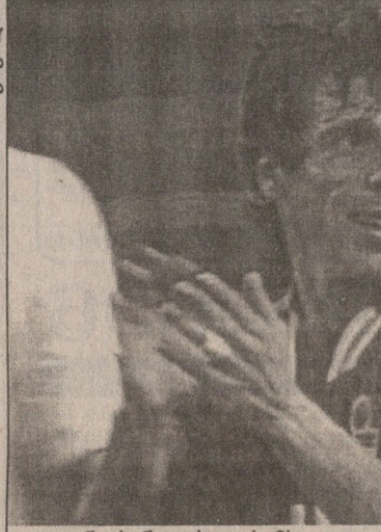
ჯანფრანკო ძოლას მსოფლიოს ჩემპიონატზე არასდროს გაუბრწყინია

გუნდში „სარბელში“ ვიუწყებდით, რომ ის შეხვედრა ფრედ 2:2 დასრულდა. დღეს ინგლისური კლუბის იტალიელი ლეგონერის — ჯანფრანკო ძოლას ინტერვიუს საინტერესო ნაწყვეტებს გაგაცნობთ. ეს ინტერვიუ ძოლას პოპულარული სპორტული გაზეთის „გაეტა დელო სპორტის“ ერთ-ერთმა მუქმევს. მას მერე ჩემი ერთადერთი მიზანი მსოფლიოს ჩემპიონატზე თამაში იყო. სამწუხაროდ, აღმოჩნდა, რომ ამ ოცნებას ასრულებდა არ ეწერა.