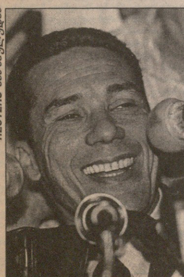
REUTERS სან პაულუსიდან