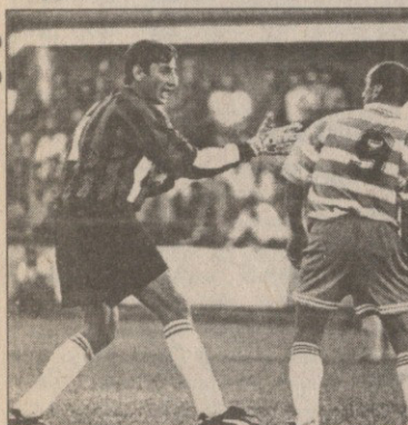
16 აგვისტოს სამკრედიანოში „ბერია“ — „ბათუმს“ რომ სძლია, მას შემდეგ საკუთარ მოედანზე დაბრუნდა...

ფინა ტურში „ლოკომოტივი“ პირველ ადგილზე მყოფი „ვიტ ჯორჯია“ დაამარცხა, ხოლო იმერული ლამაზი სურათები შე-