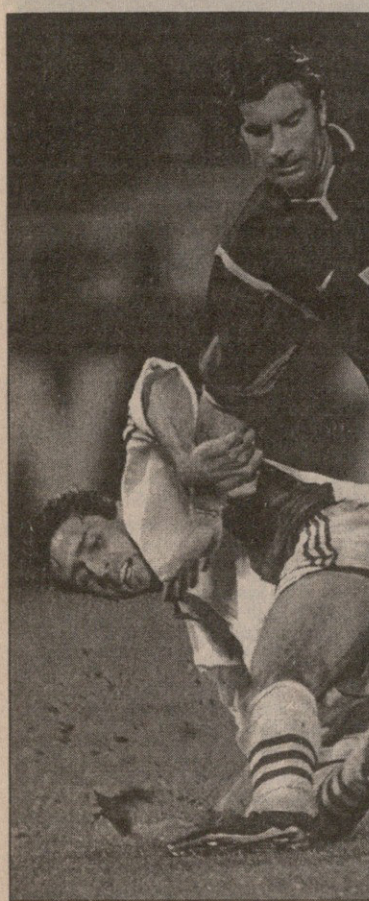
უნგრეთი — პორტუგალია. ლუშ ფიგუშა (№7) ჰალმის აჭობა, სტუმრებმა მასპინძლებს

ნზე მყოფმა 20 ათასმა გულშემატკივარმა უცნაურ სიტყვების თანხლებით ხრისტო ბონევის გადაყენება მოითხოვა. მართლაც იყვნენ, მასპინძლებმა ძალიან ცუდად ითამაშეს და არცთუ ძლიერ მეტოქეს ლაღად თამაშის საშუალება მისცეს.