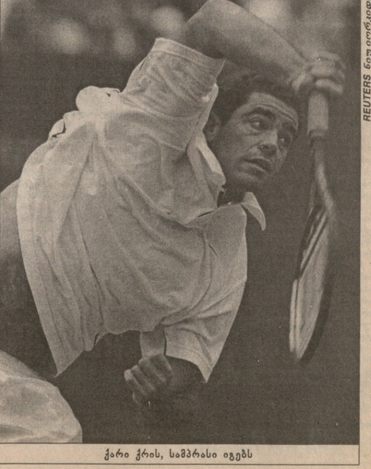
REUTERS ნიუ იორკიდან