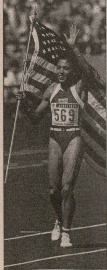
ფლორენს გრიფიტ ჯონინერი. სეულში ტრიფუფის ფაში

ფლორენს გრიფიტ ჯონინერი... მძლეობის სამყაროში ამ სახელის გაგონებაზე უკლებლივ ყველას, მსოფლიოს ყველა დროის უსწარუესი ქალის უამრავ კეთილმოსურნესაც და თითო-ორილა მტერსაც ერთადერთი სურათი წარმოუდგებათ თვალწინ — იშვიათი აღნაგობის ათლეტი ქალი ხელგანწევი პირველი მობის ფინიში ხაზთან და მიშვიდვლ სახეზე დაფენილი ღმილითი ჰაეროვან კონცნას უგზავნის მორიგი სასწაულებრივი რბენის ხილვით აღფრთოვანებულ ქობათ. სეულის 1988 წლის ოლიმპიადის ტრიუმფატორი მართლაც განუმეორებელი მოვლენა იყო მძლეობისაში ჯონინერმა მხოლოდ მისთვის დამახასიათებელი, სხვებისგან საოცრად გამორჩეული სტილითა და გარეგნობით სამუდამოდ დაიმკვიდრა ადგილი მილიონობით გულშემატკივრის სსოვნაში. ახლა კი ხალხი, ვინც ამერიკელ სპრინტერს თავგანს სცემდა და თითქმის აღმერთებდა, მხოლოდ ჯონინერის სურათების თვალთვრებითა და მისი ცხოვრებისეული მომენტების გახსენებით თუ იხუფებებს თავს, რადგან... 38 წლის ქალს, მოსიყვარულე მეუღლისა და პატარა გოგონას შემყურე დღვას თავი უბედნიერეს ადამიანად რომ მიანდა, მოლოდინელად გულმა უმტყუნა. ამ ტრაგიკულმა შემთხვევამ სპორტულ სამყაროს უმეორფასესი პიროვნება წართვა — სამაგიეროდ, დაუსრულებელი მითქმა-მოთქმის საბაბი მისცა მათ, ვისაც ჯონინერის სიღაღის არასოდეს სჯეროდა და ვინც ამ მორბენლის ყველა წარმატებას აკრძალული პრეპარატების — უფრო მართლმად კი ღობინგის გამოყენებას მიაწერდა.