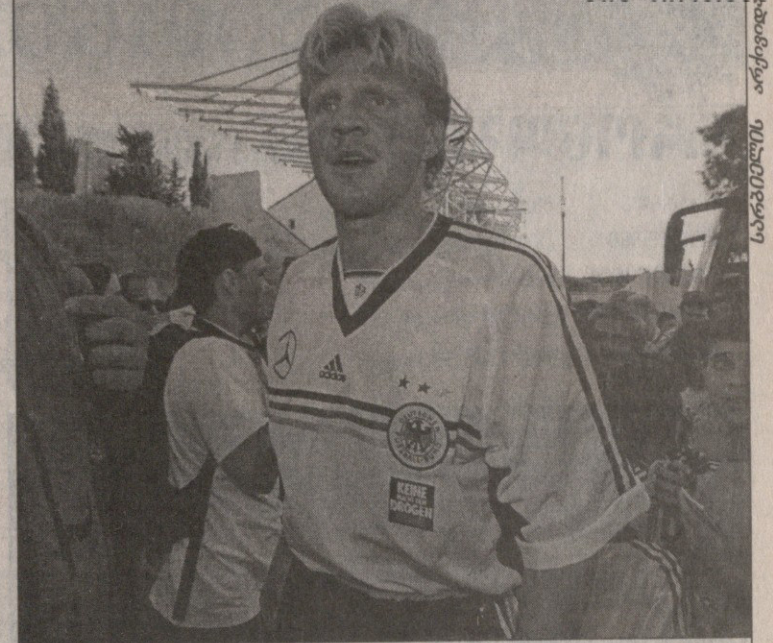
შტეფან ეფენბერგმა ნაკრებს „ბაიერნი“ ამოხონა

„მალიან სამწუხაროა, ასე რომ მოხდა. ეფენბერგი დიდი ძალა იქნებოდა. მიუხედავად ამისა, იმედი მაქვს, ძლიერ გუნდს შეეკავა. მან გადაწყვეტილება თავად მიიღო და ვერ დატოვებ, შეცვალის“ — ასეთი კომენტარი გაუკეთა ფეხბურთელის მიერ გადადგმულ ნაბიჯს რიბეკმა. ეფენბერგის წასვლამ მწვრთნელს გეგმანად აუჩინა გეგმები. მას ცენტრალური ადგილი უნდა დაეკავებინა გუნდში ლითონ მათეუსთან და ოლივერ ბიზოფთან ერთად. ახლა მისი შემცვლელის მოსაძებნად რიბეკს დიდი შრომა მოუწევს. „მე ახლა კლასიკური მათეუს ნომერი მჭირდება, ისეთი, რომელიც ეფენბერგს სრულფასოვნად შეცვლის. სამწუხაროდ, მალიან ცოტა დრო მაქვს, შეიძლება ითქვას, ცაიტრატში