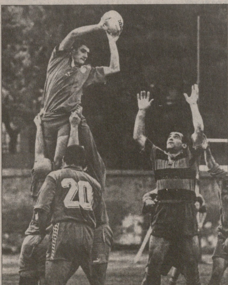
ასე — ექსპრესი. გუშინ ექსპრესი, მოულოდნელად დაამუხრუჭა

ფლორენს გრიფიტ ჯონინერი... მძლეობის სამყაროში ამ სახელის გაგონებაზე უკლებლივ ყველას, მსოფლიოს ყველა დროის უსწარუესი ქალის უამრავ კეთილმოსურნესაც და თითო-ორილა მტერსაც ერთადერთი სურათი წარმოუდგებათ თვალწინ — იშვიათი აღნაგობის ათლეტი ქალი ხელგანწევი პირველი მობის ფინიში ხაზთან და მიშვიდვლ სახეზე დაფენილი ღმილითი ჰაეროვან კონცნას უგზავნის მორიგი სასწაულებრივი რბენის ხილვით აღფრთოვანებულ ქობათ. სეულის 1988 წლის ოლიმპიადის ტრიუმფატორი მართლაც განუმეორებელი მოვლენა იყო მძლეობისაში ჯონინერმა მხოლოდ მისთვის დამახასიათებელი, სხვებისგან საოცრად გამორჩეული სტილითა და გარეგნობით სამუდამოდ დაიმკვიდრა ადგილი მილიონობით გულშემატკივრის სსოვნაში. ახლა კი ხალხი, ვინც ამერიკელ სპრინტერს თავგანს სცემდა და თითქმის აღმერთებდა, მხოლოდ ჯონინერის სურათების თვალთვრებითა და მისი ცხოვრებისეული მომენტების გახსენებით თუ იხუფებებს თავს, რადგან... 38 წლის ქალს, მოსიყვარულე მეუღლისა და პატარა გოგონას შემყურე დღვას თავი უბედნიერეს ადამიანად რომ მიანდა, მოლოდინელად გულმა უმტყუნა. ამ ტრაგიკულმა შემთხვევამ სპორტულ სამყაროს უმეორფასესი პიროვნება წართვა — სამაგიეროდ, დაუსრულებელი მითქმა-მოთქმის საბაბი მისცა მათ, ვისაც ჯონინერის სიღაღის არასოდეს სჯეროდა და ვინც ამ მორბენლის ყველა წარმატებას აკრძალული პრეპარატების — უფრო მართლმად კი ღობინგის გამოყენებას მიაწერდა.