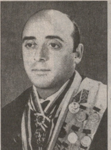
ოლიმპიური თამაშების ჩემპიონი. რამდენჯერ მიიღებდა ამ უდიდეს პატივზე ბავშვობაში, რა მიუწოდებდა მეგობრებს იგი ამიტომ ტოკიოს ოლიმპიად საუკეთესო ფურცელს ჩემს სპორტულ ბიოგრაფიაში.

იმ ხმლით ნუგზარ ასათიანი, 1952-1959 წლებში თბილისის „ბურჯუნიანის“ ლიტერატურის ფაკულტეტის მედიკოსი იყო. 1960-1966 წლებში „დინამოს“ სახელით იბრძობდა იყო საბჭოთა კავშირის ნაკრებში, რომელშიც 1964 წელს ტოკიოს ოლიმპიურ თამაშებში 1965 წლის მსოფლიოს ჩემპიონატში ოქროს, 1962 და 1963 წლების მსოფლიო ჩემპიონატებში ვერცხლის, ხოლო 1962 წლის მსოფლიო ჩემპიონატში ბრინჯაოს მუდლი მოიპოვა; იყო სტუმრული მსოფლიო უნივერსიტეტის მებრძოლი (1962) და სურათმწერის მეგობარი (1966), სსრ კავშირის ჩემპიონი (1962) და ოთხჯერ ტიტულიანი მსოფლიო.