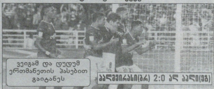
ვეიგამ და დედუმ ერთმანეთის პასებით გაიტანეს

ბრაზილიური პალმეირასი მსოფლიოს საკლუბო ჩემპიონატის ფინალშია მეორე ფინალისტი დღეს ჩელსი-ალ ჰილალის მატჩში გაირჯვევა