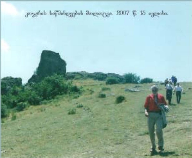
კოჯორის ხეშხხეუების პალიცვა. 2007 წ. 15 ივლისი.

უკვე ჩალოფანებული, სამწიერთოდ დარჩენილი კაცობის სიწყითად ვიდგენ და სიკვდილის წინა სურვილია ჩემი, - ხმაგუებ ზარბეად შეეძლო ამის თქმა: მიეცინზარ, ხანას.