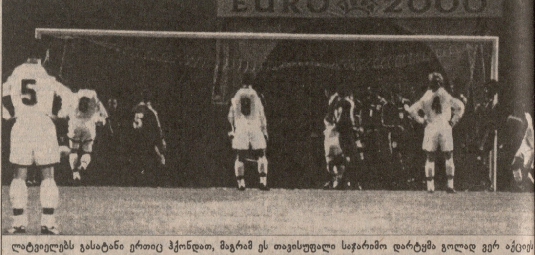
ლატვიელებს გასატანი ერთი ჰქონდათ, მაგრამ ეს თავისუფალი საჯარიმო დარტყმა გოლად ვერ აქციეს