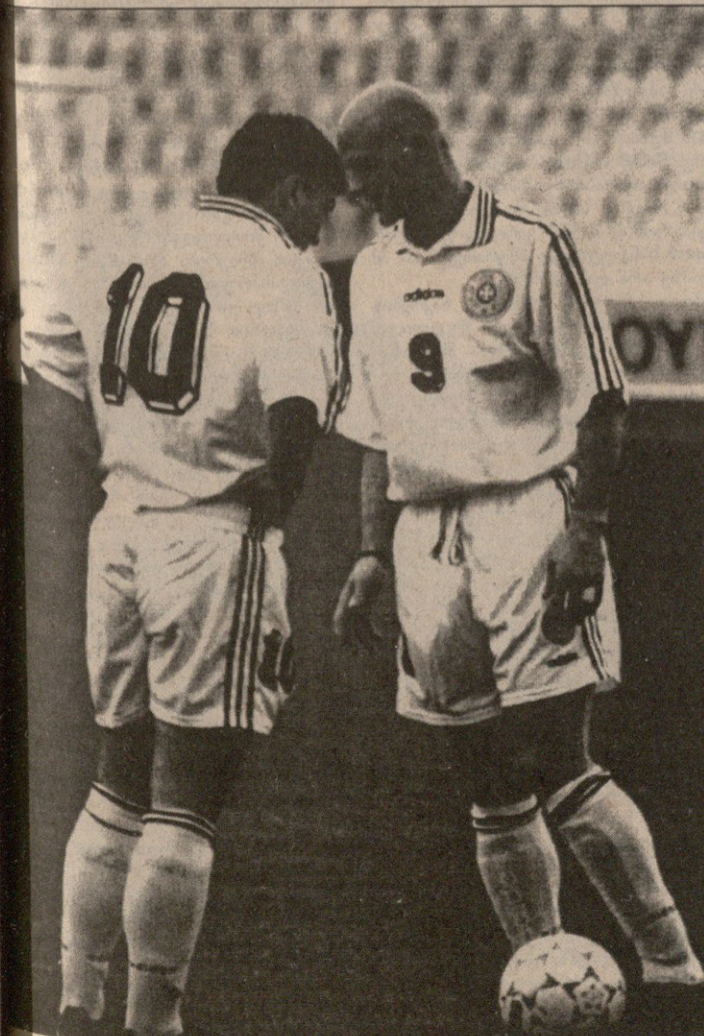
ნეტა რაზე ბჭობდნენ ქინქლიძე და ქეცბაია?

საუბრია მერე მარცხის შემდეგ, მაგრამ ნაკრების სამხარელოში ჩახვლედა ხალხმა ხმახმაღლა, თქვა შეიძლება, ასეც იყოს — ათენში ვლადიმერ გუცაევიმ შეგნებულად არ გააკეთა ერთზე მეტი შეცვლა, სურდა, ყველას დაენახა, ქართველები როგორ ცოდვილობდნენ, ყველა დაწმუნებულიყო, ამით თამაში რომ არ სურთ. გუცაევი ნაკრებში ამ მატჩების მერე ბევრ ცვლილებას მოახდენს, საამისოდ საფუძველი უკვე შექმნილია. ქართველი ფეხბურთელები ნაკრებში მოვალეობის მოსახდელად თამაშობენ — საერთო აზრი შეიქმნა. შვედეთსა და ზოგიერთ ფეხბურთელს შორის უკვე დადებული მიმდინარეობს. გუცაევი კვლავაც თავდაჭერილია, ბევრ რამეს არ ლაპარაკობს, თვალს ხუჭავს, ვერაფერობით რადიკალური ზომებისთვისაც არ მიუპარტავს. ისიცაა, რომ ზოგიერთი ფეხბურთელისთვის გუცაევისეული სიმკაცრე მიუღებელია. ის ბრძოლას, ომს, თავდადებას ითხოვს. ასეთი პრინციპით თამაშისა კი სრულიად მოსალოდნელია ვინმე ტრავმა მიიღოს და კლუბშიც უთამაშებელი დარჩეს. დმბრთმა ქნას, ცვლებოდეთ, მაგრამ დიდი ეჭვები რომ