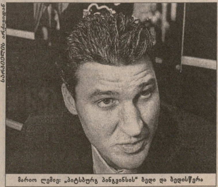
მართი ლეიკი: „პიტსბურგ პინგპინის“ ბედი და ბედისწერა

რამ განაპირობა ჯერ კიდევ ხუთი-ექვსი წლის წინ ლეიკის უკლებიერის კლუბის ფინანსური კრიზისი? 90-იანი წლების ერთ-ერთი უმარტესი თითქოს თასის მებრე მოგების შემდეგ თითქოს არაფერი უკვრდა ლეიკი, აბრი, კოვი, ფრენსისი და სხვა ვარსკვლავები ყოველ მატჩზე მრავალრიცხოვან მყურებელს უკრდნენ თავს პიტსბურგის „სივი არჩანზე“, რაც ფინანსური კეთილდღეობის საწინდარი იყო. წარმატებით გათამაშებულმა კლუბის მამულმა მთავარმა მფლობელმა თავს უფლებამ მისცა მათ შორის შემოქმედ სუპერმარინოსთან უნიკალური — 42-მილიონიანი კონტრაქტი გაეფორმებინა, რომელიც ლეიკის პოკეიდან ასეველის შემთხვევაშიც ინარჩუნებდა თავის ალას ამ ხელგამყოლობის ნაყოფს კი „პინგპინი“, მოეხსენებოთ, დღემდე იქიან. მებრე კლუბმა 1994 წელს იხარადა როცა კოკესტა და ნკლ-ის ხელმძღვანელთა შორის მომხდარი კონფლიქტის გამო სეზონი დაკარგა და დაიწყო და საბოლოოდ 84 დღე-ღამე მატჩის ნაცვლად გუნდმა მხოლოდ 48 ჩატარეს ეს ფაქტი ჰოვარდ ბოლდუინის სატელევიზიო კომპანია „FOX SPORT“-თან და „სივი არჩანს“ მესვეურ SPECTA COR MANAGEMENT GROUP-თან დადებულ არახელსაყრელ კონტრაქტებს დაემთხვა და პიტსბურგმა ერთ სეზონში 25 მილიონი დოლარი დაკარგა. უმჯობესად ამისა, პიტსბურგს ფინანსური დასკო ვერ არ ემუქრებოდა რადგანაც მართი ლეიკი ჰყავდა და აი, 1996-97 წლების სეზონის დამთავრების შემდეგ „პინგპინს“ პრინციპულით დაატყდათ თავს ზურგის რინიკული ტკივილებით შეწყუბული ვარსკვლავის განცხადება, დროა, პოკეის დაეშვიდობოთ. სწორედ ამის მერე დაიწყო ლეიკის დაღმასვლა იქნებ კომპეტაგას არ ეციათ ზურგი მისთვის, პიტსბურგის ახალ მწვრთნელ კევინ კონსტანტინს ახალი სათანო სტრატეგის შემუშავება რომ არ განე-