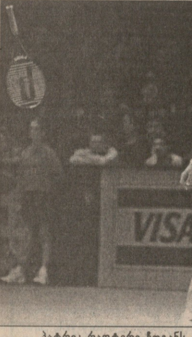
პატრიკ რაფტერი ჩოგანს დაედევნა

ანამ ვან რუსტის ნათქვამი იუარა და ყველაფერი მარტივად განმარტა, ეიცოდა, რომ მას შესანიშნავი მიღება აქვს და ცოტა ზედმეტად გაეწივრებოდა. თავისი ცუდ ფორმაში ყოფნა კი ისევე იმ ოთხი თვის წინანდელ ინციდენტს დაუკავშირა: „ხელი