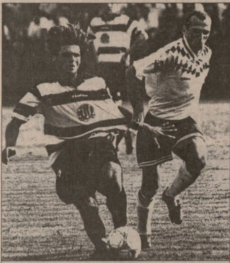
„დინამო“ — „ბათუმი“. ბოლო ხნის უმთავრესი ქართული სანახაობა

დაფიქრდეთ, განა ცოტა გვახსოვს მსგავსი შემთხვევები? თუნდაც აშშ-ში-