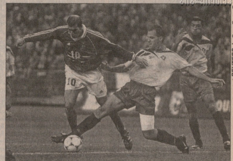
საფრანგეთი — ანდორა. ბრწყინვალე ზინედინ ზიდანი (№10) ანდორელებთანაც შეუღარებელი გახლდათ