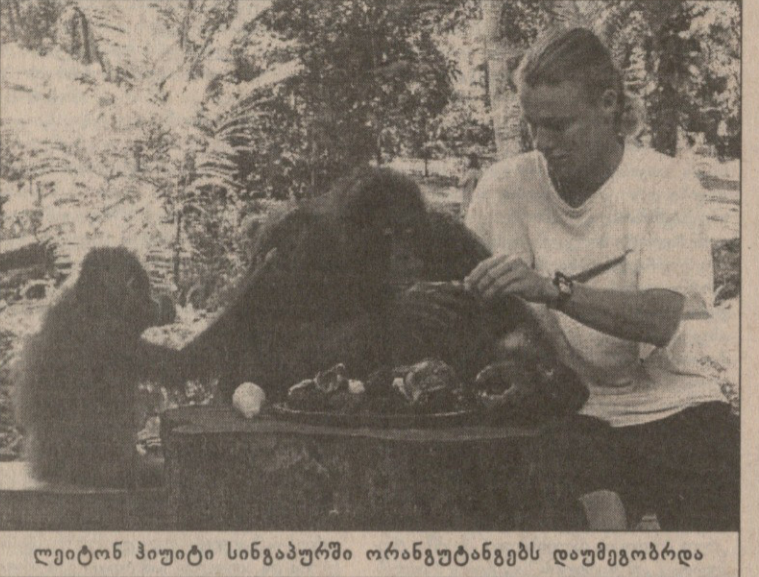
ლეიტონ ჰიუიტი სინგაპურში ორანგუტანგებს დაუმეგობრდა

პრესკონფერენციაზე მომავალი ოლიმპიადის გამართვის ადგილიც შეეიტყვეო. იგი ტამბოლში მოეწყობა 2000 წელს. ალბათ ამიტომაც, თურქეთის ჭაღრაკის ფედერაციის პრეზიდენტი ფიდექს ვიცე-