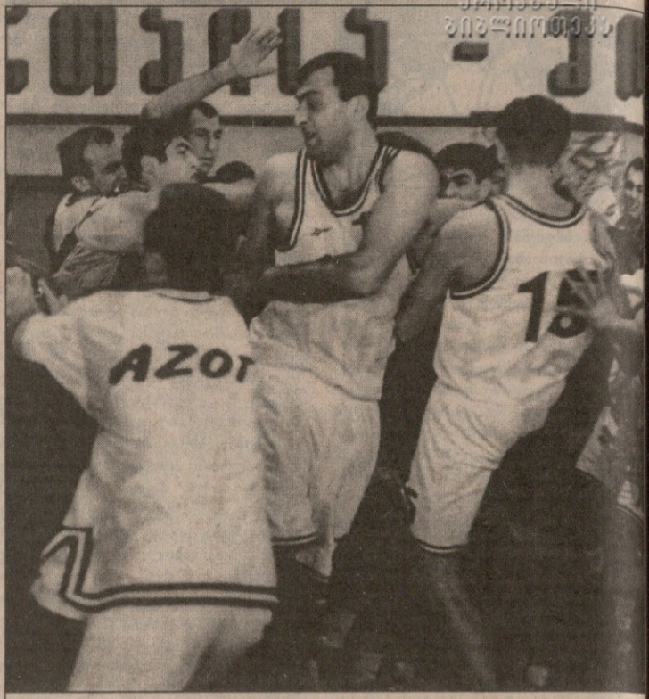
გუნდური თამაშშიც ვნახეთ და ჩხუბიც

ბოლო ჩემპიონატებში სდასუ — „აზოტის“ მატჩები ყოველთვის დამაბული იყო და იმიტომაც რომ ვნებათაღელვის გარეშე ჩაველო. გუნდები ერთმანეთისთვის უხერხულ მეტოქეებად იქცნენ და დიდი თუ მცირე ინციდენტი მათ შეხვედრას ხშირად თან სდევდა. ამიტომაც ეს ფედერაციას უნდა გაეთვალისწინებინა (მოეხელავე იმისა, რომ პლეი ოფის მატჩი არ იყო) და შედარებით მკაცრი მსაჯები შეეჩინა. არ მინდა, ვუშინდელი მატჩის განმსჯელთა განაწინება, მაგრამ მათმა რბილმა და ზოგჯერ დაგვიანებულმა გადაწყვეტილებამ შეუწყო ხელი იმას, რაც შემდეგ მოხდა.