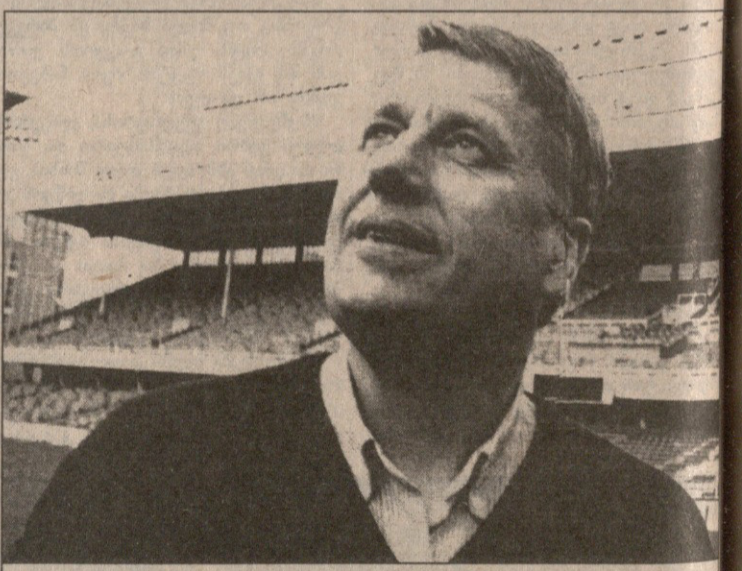
ტომი სოღარბერგს თვალის ევრო 2000-სკენ უჭირავს

სწორედ მან გაუტანა. მს.) წინ, მეტოქის კართან ისევე კენეტ ანდერსონია მოთავარი. ისტორიაში იყო ასეთი, გუნარ გენრი, ნაკრებში ყველაზე მეტი გოლის გამტანი. დღეს ანდერსონი მის შედეგს სამად სამი გოლით ჩამორჩება. ანდერსონის მეწყვილეობა კი იორგენ პეტერსონს ხელეწიფება. მან უკვე დაიგლო მოწინააღმდეგის საჯარიმოში სხარტად მოაზროვენ ფეხბურთელის სახელი. საკლად კი ისევ საყოველთაო სისწრაფის არქონა და კიდურა მცველები რჩებიან. კიდურა მცველთა სისუსტე სოღარბერგს მოწინააღმდეგის შეტევათა მოსაგერიებლად ზრუნების ნაირგვარობას უხლებდაც. აგერ უკვე ოთხი წელიწადია, შვედური დაცვის ბურჯებად შუაკაცები, პატრიკ ანდერსონი და იონას ბიორკენდნი რჩებიან, თუმცა აგასულ წელს გერმანულ „მიონხენგლადბახში“ მოთამაშე ანდერსონმა რამდენიმე გულსატყენი შეცდომაც დაუშვა და როგორც ამბობენ, ამან კალამაზიდან ამოავლო. სოღარბერგს აიკის ფეხბურთელის, იოჰან მალინსაც ეძიებდა. მალინი უმუღავათო მებრძოლია. მას ხშირად შეედენი ჯოუნსაეც უწილებენ. თუ გამოცე-