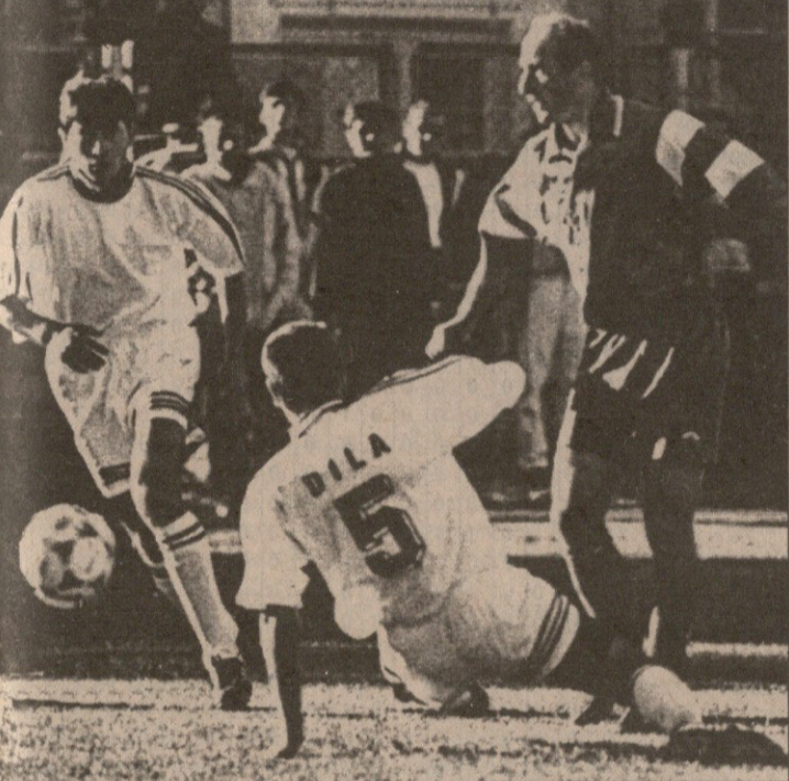
„დილა“ — „ტორპედო“ შარშანდელი შეხვედრა უშეღავათო ბრძოლაში წარიარია