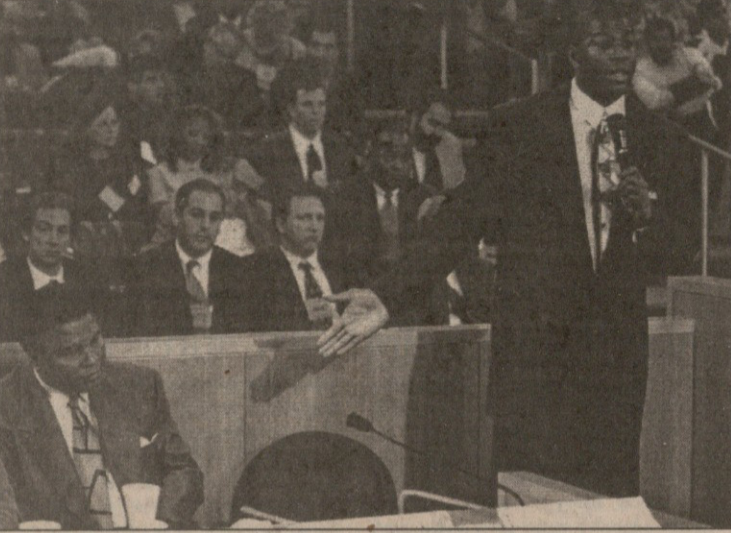
ტაისონს თავდებად მუჰამედ ალი (მარცხნივ) და მეჯიკ ჯონსონი დაუდგნენ