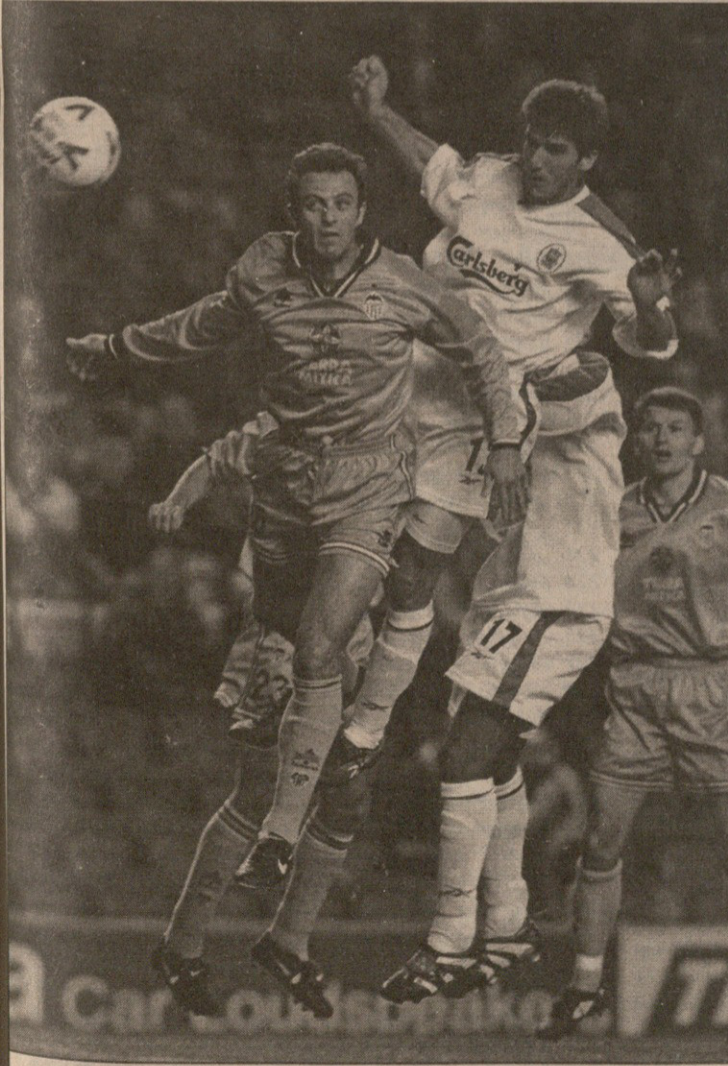
ლივერპული — ვალენსია. რიდლემ და ფარინოსმა (მარცხნივ) ბეგრი კი ბბროლეს, მაგრამ მატჩი მინც უგოლოდ დასრულდა