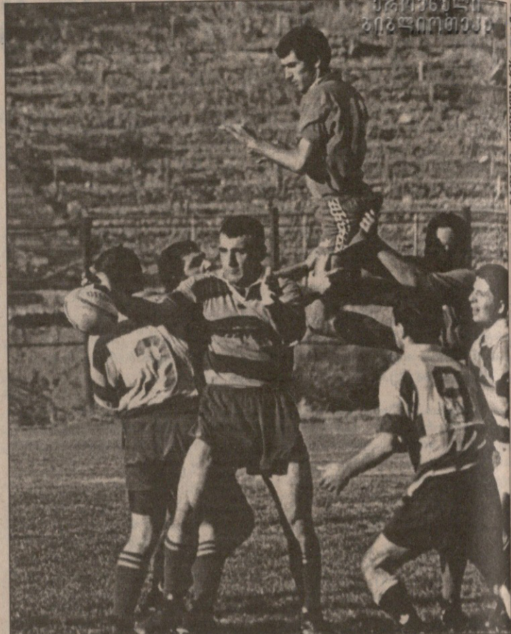
„ექსპრესი“ აუტებშიც ყოჩაღობდა