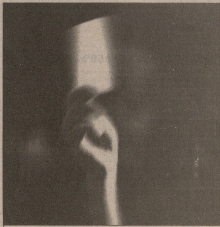
ვის იუნთებენ მწვანე შუქს პარასკევს ყრილობის დელეგატები?

გარდა მშრალი კანონებისა, არსებობს კიდევ დაუწერელი მორალური კოდექსი, რომლის თანახმადაც, ვთქვით, სამართალში მიცემულს, რაგინდ მართალი იყოს, უდანაშაულობის პრეზუმპცია არ ათავისუფლებს წმინდა მორალური პასუხისმგებ-