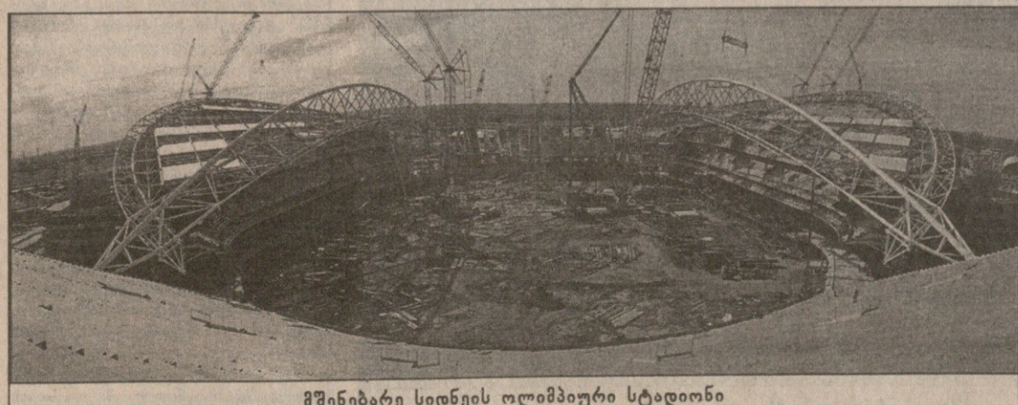
შენებარე სიდნეის ოლიმპიური სტადიონი

ის, რაც უკვე დაიწერა „სარბიე- ში“. კერძოდ, ვიზიტზე უარის თქმის დასაფუძვლები მდებარის, როგორც თა- ვს მოგვწერეს, გაუთვალისწინებიათ ჩვენს სპორტურულ რეგონში არსებული მძიმე ეკონომიკური მდგომარეობა“, რასაც ისი- ლადაც ვიზიტზე ჩვენი დელეგაციის წევრთა მომხრობლობა შემდგომ დაბრუნებაზე.