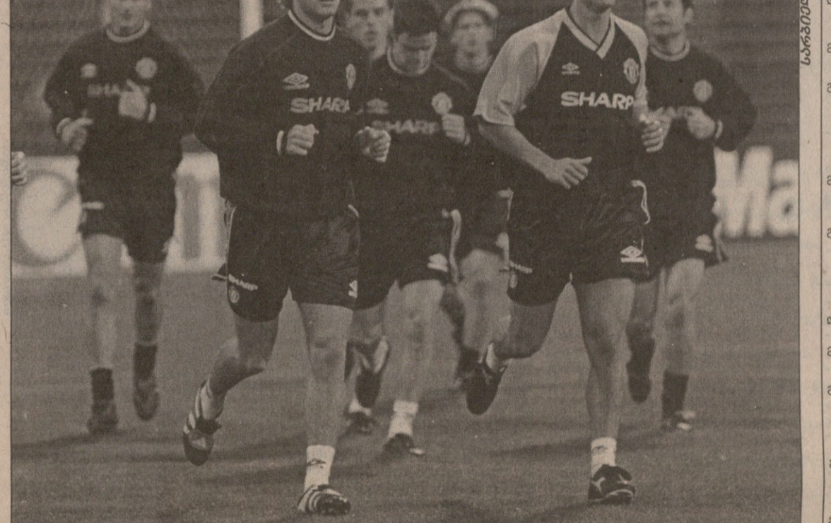
ივლიში მინჩესტერელებმა ამხანაგურ მატჩში „ბრონდბიუ“ ნი გაანადგურეს. რა მოხდება დღეს?

— მისარია, ბასკეთში რომ ვარ. ასე მგონია, შინ ვარ. ძალიან მიყვარს ტურინის „იუვენტუსი“, მაგრამ კარიერას, ალბათ, სხვაგან დაგამთავრებ. ძალიან დიდი სურვილი მაქვს, ჩემი ბოლო კლუბი