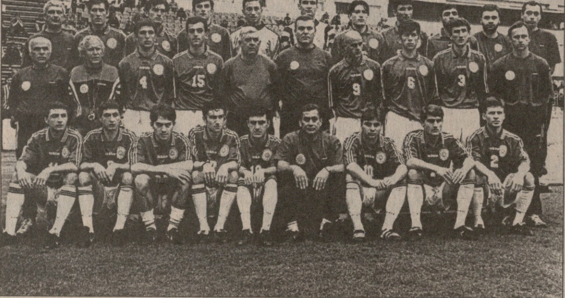
საქართველოს ნაკრებმა თუ ასე გააგრძელებს, ეს ფოტო შეიძლება ბევრს სამახსოვროდ დარჩეს

ახლანდელ ქართულ სანაკრებო სიტუაციაზე, ჩვენი აზრით, ყველაზე მეტად ბულგარული ნაკრების თარგი უდგება, სადაც პირველ რიგში სტოიჩკოვს, პენევებს