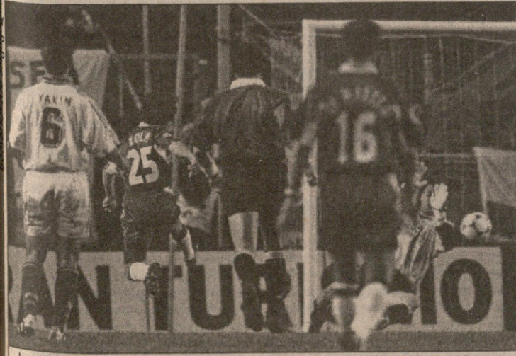
ეს გაზაფხულზე იყო — თასების თასის ფინალში ძოლამ გადამწყვეტი გოლი გაიტანა. ჯანფრანკო იგივეს ამ გაზაფხულზეც აბირებს

„ინტერთან“ შესანიშნავი გამარჯვების შემდეგ ბიჭები საბრძოლველად არიან განწყობილნი. არა მგონია, გამოიცხადონ იყოს ჩვენი გამარჯვება. მიღანში მოვლამ ფრთხილ შეგვასხა. „პარტიზანის“ ძილება „ინტერის“ მერე ერთობ კარგი რამ იქნება — სვენ გორან ერიქსონი,