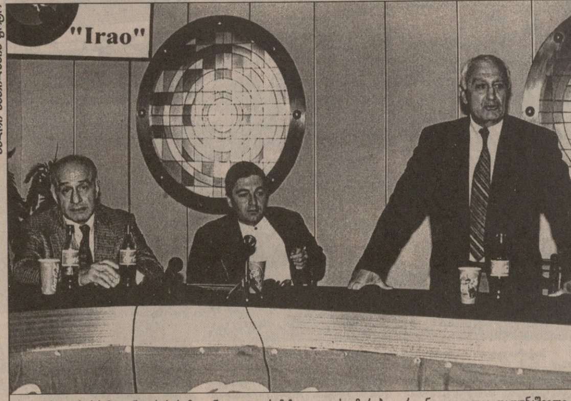
ფედერაციის პრეზიდენტობის სამი კანდიდატი: რამაზ გოგლიძე, მერაბ ჟორდანია და ილია დათუნაშვილი

თა პირდაპირი მოვალეობაც ხომ ესაა. ნებისმიერი პოზიციის და მოსაზრების დაფიქსირება უკვე ერთგვარი ტენდენციაა, ასე რომ, ნურავინ დაიწყებს არატენდენციური ვარ. ქართულ ფეხბურთში მიმდინარე მოვლენებზე ყველას თავისი წილი პასუხისმგებლობა აკისრია — ფედერაციის, ფეხბურთელს, მწვრთნელს, გულშემატკივარს და ჟურნალისტს. ფეხბურთი ქართული ხალხისთვის ერთ-ერთი სულიერი საზღვოს წარმოადგენს და ამ საქმეში განხე დღეა დანაშაულია. ყველამ ხმადალა უნდა გამოთქვას თავისი აზრი და ნურავინ იფიქრებს, სხვის საქმეში ვერ ვიყო. ფეხბურთი საერთო ეროვნული საქმეა და ყველას შეხედულებას უნდა ანგარიში გაუწიოთ. თითოეულ კანდიდატზე ჩვენ ჩვენი პოზიცია ჩამოვიყალიბებ. მისი გაცხადება კი სულაც არ ნიშნავს, ვინმეს რაიმეს კარნახობდეთ და ჭკუას ვასწავლიდეთ. ყველაზე დიდი შანსი ალექსანდრე ჩივამდეს აქვს. ჩვენ ვფიქრობთ, რომ ოთხთაგან ყველაზე ნაკლები მორალური უფლება სწორედ ბატონ ალექსანდრეს უნდა გააჩნდეს პრეზიდენტობაზე, რადგან მისი პირველკაცობის დროს ქართულმა ფეხბურთმა არანაშუადი ფიასკო განიცადა. როცა უპრინციპოს და მართვადს გიწოდებენ და ვერანაირად ახერხებ თავის მართლებას, ეს ცუდის მანიშნებელია. ჩივამე ყრილობის გადადებამდე ორი კვირით ადრე ამომრჩევლებთან შეხვედრისას მერაბ ჟორდანის პროგრამის თეზისებს აკრტიკებდა, შემდეგ კი განაცხ-