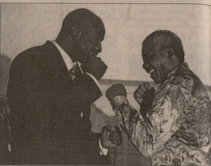
ევანდერ ჰოლიფილდი და ნელსონ მანდელა

1974 წელს ზაირმა კრივის ისტორიაში ბევრის მიერ საუკეთესო ბრძოლად შერაცხულ „Rumble in the Jungle“-ს (ჩვენებურად „ბრძოლა ჯუნგლებში“) უმასპინძლა, რომელშიც ლეგენდარულმა მუჰამედ ალიმ დაუმარცხებლად მინეული ჯორჯ ფორმანი გვემა და აი, ისტორიული მატჩიდან ზუსტად მეოთხედი საუკუნის შემდეგ შეკონტინენტს კიდევ ერთი „საუკუნის ბრძოლის“ მასპინძლობა სურს — მიმე წლის ტიტულების გამაერთიანებელი შეხვედრისა ლენოქს ლუისსა და ევანდერ ჰოლიფილდს შორის. ეს იდეა სამხრეთ აფრიკის პრეზიდენტის, ნელსონ მანდელას ქალიშვილ ზინდის ეკუთვნის, რომელიც ამ დღეებში კრივის პირველ პრომოუტერს ლონ კინგსაც შეხვდა. „ჩვენ კინგსაც შეგვხვდა და მისტერ ჰოლიფილდსაც. ორივე დაინტერესებულია, მატჩი სამხრეთ აფრიკაში ჩატარდეს — ზინდის არც ის აწუხებს, რომ წესით და რიგით (ესე იგი, მაქსიმალური მოგების მისაღებად) მსგავსი შეხვედრები ლას ვეგასში უნდა გაიმართოს — სამხრეთ აფრიკის ძალიან, ძალიან დიდი მანძილი გააჩნია“. ზინდი ოჯახში კრივის ერთადერთი მოყვარული არ განსვამს, თავად ნელსონ მანდელა ახალგაზრდაში მოკრივე იყო, ამჟამად კრივის ახალ ამბებს არასდროს