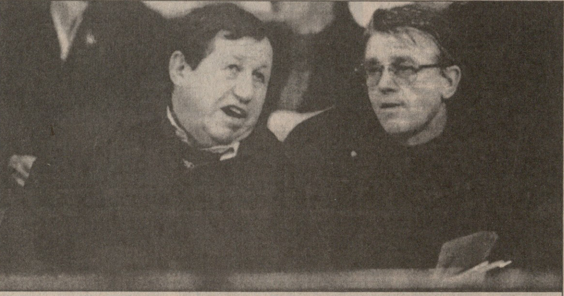
გი რუ და ემე რაყე — ყველა დროის ერთ-ერთი საუკეთესო ფრანგი მწვრთნელები

...იმ ხანებში, „ოსერში“ ბევრისთვის უცნობი გი რუ რომ გამოჩნდა, გუნდი, უმეტესი პერიფერიული კლუბების დარად, საფრანგეთის ჩემპიონატის უსუსტეს ლიგაში თამაშობდა. საუკუნის დასაწყისში დაარსებულ „ოსერს“ ამბიციები არ ჰქონდა, მოყვარულთა შორის ბურთობით კმაყოფილებოდა და არც აღზევებისკენ ისწრაფვოდა მაინცდამაინც. ეს მანამდე იყო, სანამ გი რუ მივიდოდა. აი, 1961 წლიდან კი ცვლილებები შესამჩნევია გახდა.