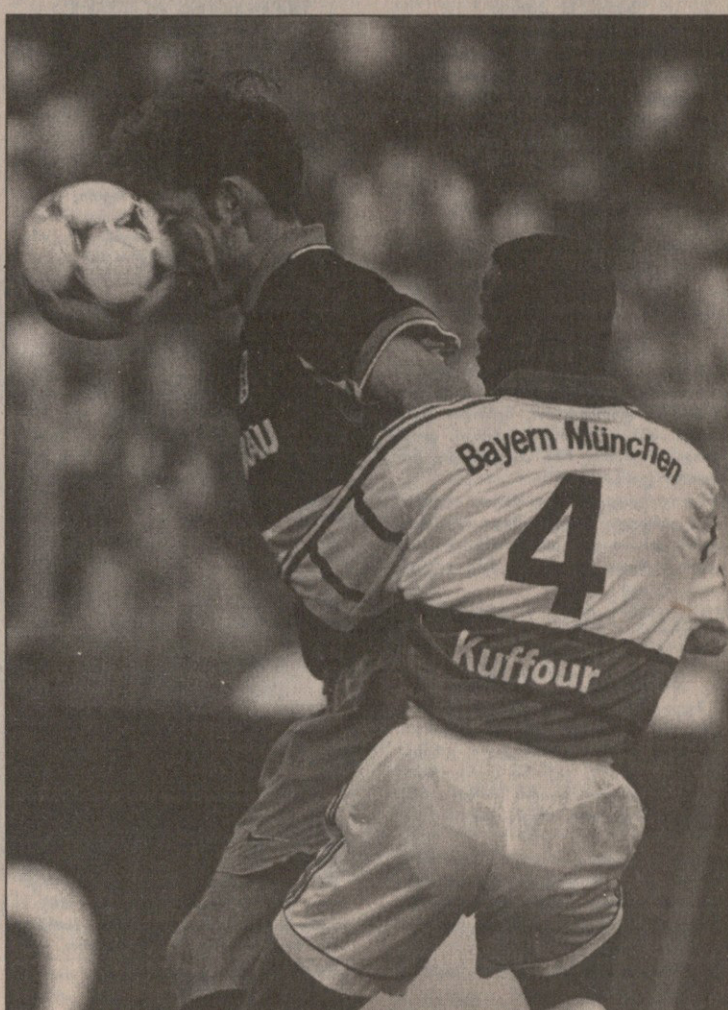
ბაიერნი — მიუნხენ 1860. შროტის „მიუნხენი“ კუფურის „ბაიერნიან“ ბრძოლის მიუხედავად ვერას გახდა

უგოლოდ დასრულდა მატჩი ლევერკუზენში, სადაც „ბაიერნი“ „შტუტგარტი“ მოიგო. არადა, გატანის შანსი ორივეს ბე-