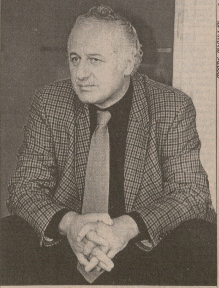
რას მოუტანს ქორქია „ტორპედოს“ და „ტორპედო“ ქორქიას?