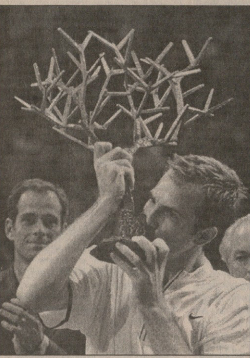
გრეგ რუხეციის პ(ა)რტიკინალიმ შემოეჭამა

პარიზის ღია პირველობა. საფრანგეთი. დარბაზი, ხალიჩა. საპრიზო 2,55 მეტრიანი $ მეოთხედფინალი: პიტ სამპრასი (1) — მარკ ფილიპუსისი (ავსტრალია) 6:3, 6:3; ვეგენი კაფელინოვი (8, რუსეთი) — მარსელო რიოსი (2, ჩილე) 6:3, 6:2; ტოდ მარტინი (აშშ) — ანდრე აგასი (5, აშშ) 4:6, 6:4, 6:4; გრეგ რუხეცი (13, ინგლისი) — მანუელ გუსტაფსონი (შვედეთი) 6:3, 6:2.