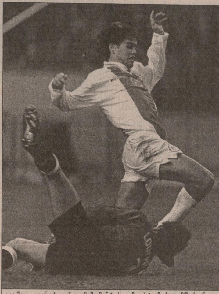
აიაქსი - ვინდჰოვენი. ამ მონეტის გამო სტუმართა მწვრთნელი ბობი რობსონი აიაქსელი დანის გაძევებას ითხოვდა

ინფორმაცია: ვატერუსი, დირქსი, ნი... (82), თინი, ივანი, ხოსლოვი, ფუ... (86), ვან დერ დოლიერი, ნილისი (ლო... (77), ვან ნისტელროი