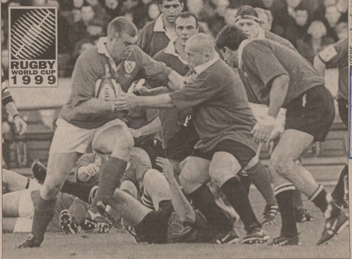
მსოფლიოს თასის უმსარჩვევე მატჩი დუბლინი, „დენსდაუნ როუდი“, 14 ნოემბერი