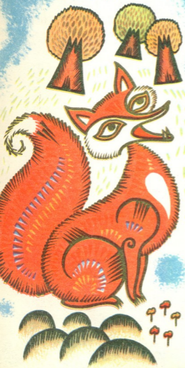
მუსიკა ნანა შავაღვილინი (5 წლის)