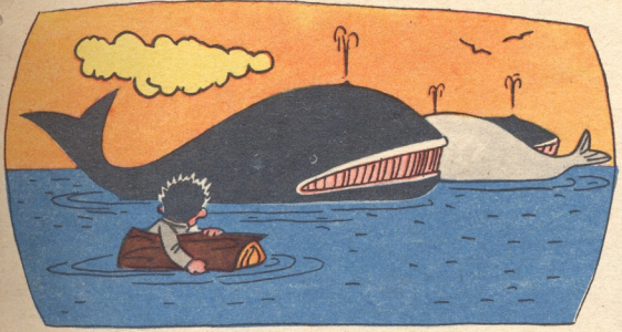
ნ. მერე—ზღვაში... რომ არ დამხრჩვალიყო, მორს ჩაეჭიდა და ისე ცურავდა. გეშაპები რომ დაინახა, შიშით თმა ყალყზე დაუდგა.