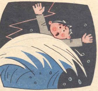
შ. უეცრად თავსხმა წვიმა წამოვიდა, და ზაქარა ნიაღვარმა გაიტაცა.