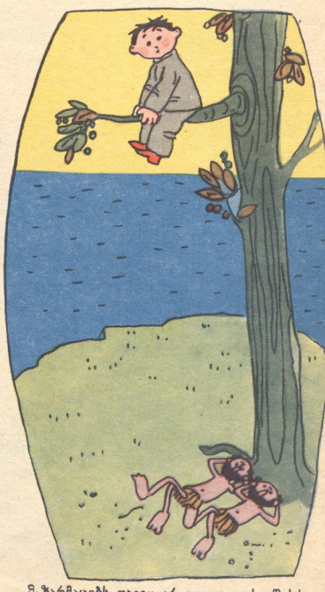
9. ზარმაცებს თავიც არ აუღიათ, ისე შესძახეს:—ჰეი, ბიქო, ჩამოყარე კაკლები და რომ ჩამოხვალ, ძმურად გავიყოთო.