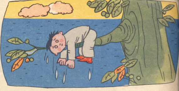
და ერთ პატარა კუნძულზე კაკლის ხის ტოტზე შეისროლეს.