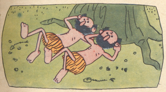
8. ამ კუნძულზე ორი უზარმაცეხი კაცი — აჩარა და ბაჩარა ცხოვრობდა. ისინი არხეინად იწვნენ ხის ძირში და ელოდნენ, კაკალი როდის ჩამოვარდებაო.