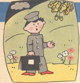
ზარმაცი ზაქარა სკოლისაკენ მიდიოდა.