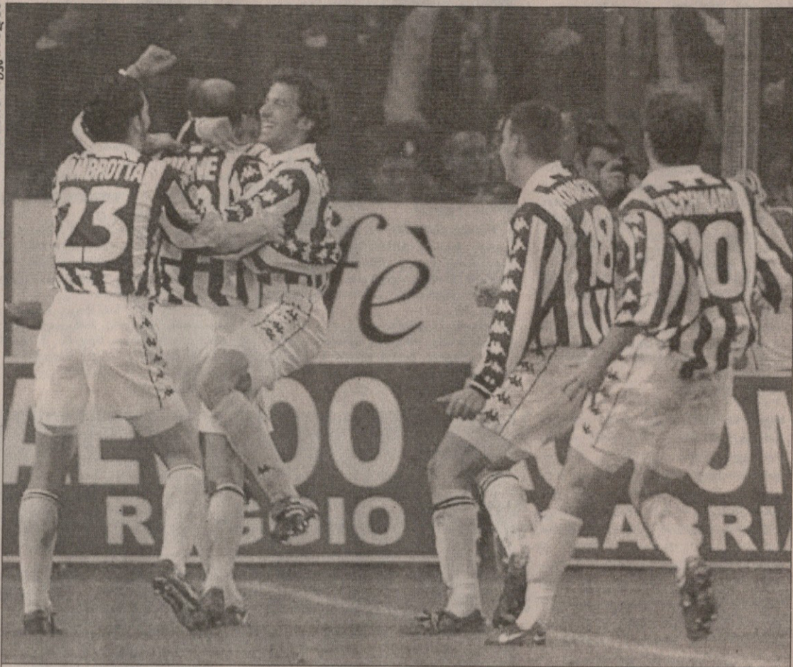
რეჯინა — იუვენტუსი 0:2. ტურინელები ზინედინ ზიდანს გოლის გატანას ულოცავენ

0:1 პიოვანი (45), 1:1 დი ფრანკესკო (47), 2:1 ტოტი (75) რომა: ნანტინოლი, რინალდი (გურენ-ნო 77), ალდარი, მანგონე, კაფუ, ტომასი, დი ფრანკესკო, კანდელა, ნა-კატა (დელვეკო 46), ტოტი, მონტე-ლა (ბლასი 77) პიანცენა: რომა, ლამაჯი, დელი კარი, ვერნოვოდი, საკეტი, ბუზო (დი ნა-პოლი 77), კრისტალინი, მორონე, მა-