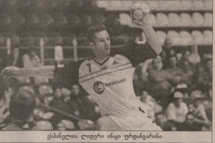
ესპანელთა ლიდერი ინაჩი ურდანიგარინი