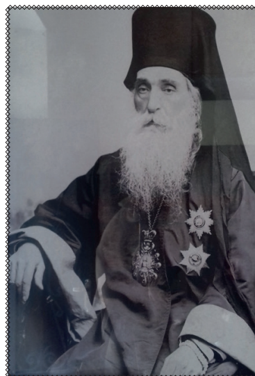
იმერეთის მისიონარი წმ. ბაბრიელი (ძიმოძი)