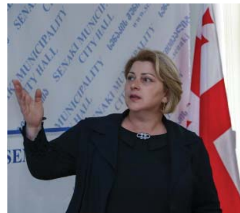
დურა ელექტრონულ ფორმატში აქვს წარმოებული, რაც, თავის მხრივ, სახელმწიფო ტენდერების გამჭვირვალობას, მოქნილი გარემოს შექმნას, არადისკრიმინაციულობას, სამართლიან შეფასებას უზრუნველყოფს და ასევე, მკვეთრად ამცირებს ტენდერში მონაწილეობის დროსა და ხარჯებს.

პრეზენტაციის მონაწილეებს სახელმწიფო შესყიდვის საშუალებები, ელექტრონული ტენდერის ჩატარების მეთოდები და საფუძვლები გააცნო. ასევე, ყურადღება გაამახვილა სახელმწიფო შესყიდვების სრული ციკლის სწორი დაგეგმვის წარმართვისთვის საჭიროებების განსაზღვრასა და ელექტრონული სისტემის უპირატესობაზე. პრეზენტატორმა ხაზი გაუსვა იმ გარემოებას, რომ საქართველო ერთ-ერთი ნოვატორი სახელმწიფოა, რომელსაც ტენდერთან დაკავშირებული ყველა პროცე-