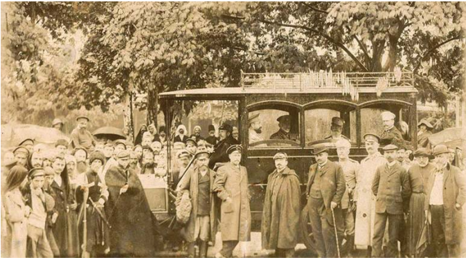
ქართული პრესის ფურცლებზე გამოქვეყნებული ინფორმაცია ახალ სენაკში მოძრავ საქართველოში პირველ ავტომანქანაზე (გაზეთი დაცულია საქართველოს პარლამენტის ეროვნულ ბიბლიოთეკაში)