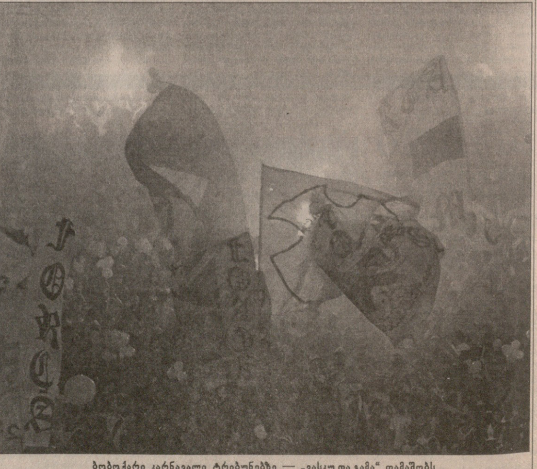
ბობოქარი კარნავალი ტრიბუნებზე — „ვასკუ და გამა“ თამაშობს

მავანმა არგენტინელმა გულშემატკივარმა კინოლოგიაში ვადატრიალება მოახდინა. აქამდე ვიცოდით, რომ ძალით მონადირეს ემხარებოდა, სახლს დარაჯობდა, ალბეში გაყინულ ტურისტებს, ხოლო ჩემოდნებში ნარკოტიკებს ეძებდა. ამ არგენტინელმა კი