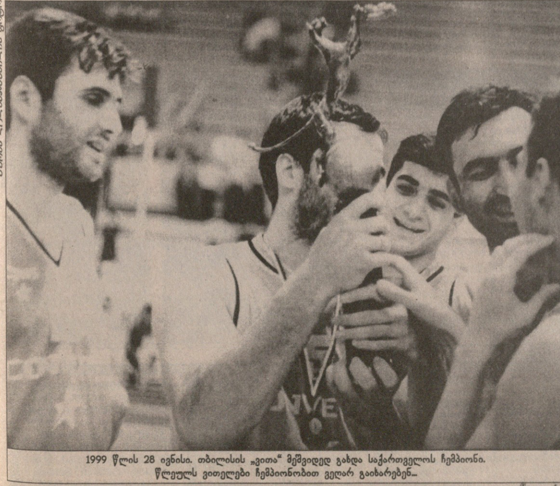
1999 წლის 28 ივნისი. თბილისის „ვიტა“ მეშვიდედ გახდა საქართველოს ჩემპიონი. წლეულს ვითვლება ჩემპიონობით ვეღარ გაიხარებენ...