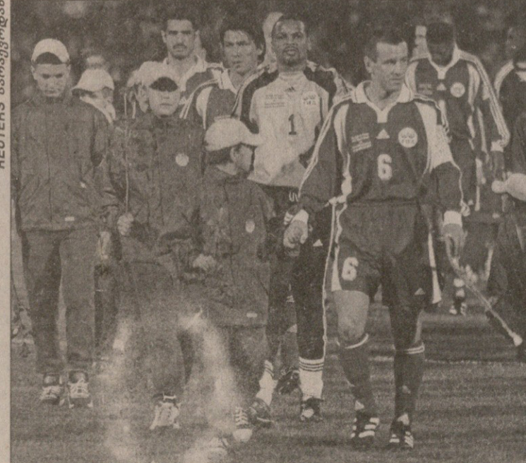
ფიფას ნაკრებს ბრაზილიელი დუნგა (№6) კაპიტნობდა

მთლიანად მატჩის მსვლელობისას 20 შეცვლა განხორციელდა. შემოსულიც ფულის ნაწილი კი სარაგოსის ობო-