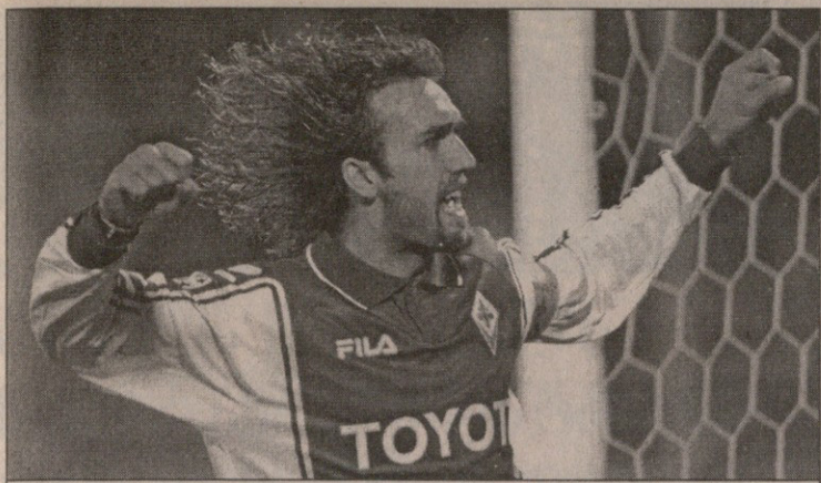
გადავა ბატიგოლი „ინტერში“?