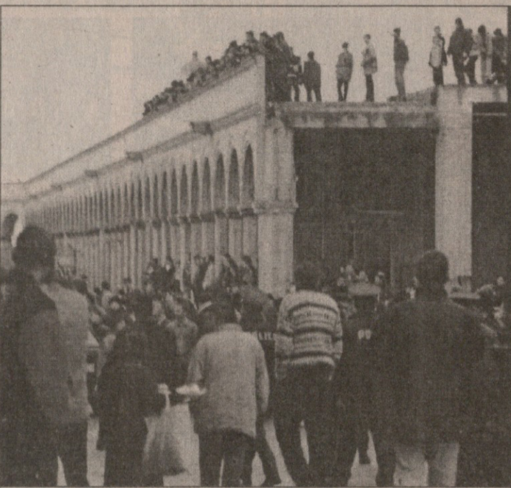
14 აპრილს ბათუმში „დინამოს“ სტადიონის შორიბალოს პოლიციელთა სიმეჭრება

ოფიციალური ინფორმაციით, ვიტელთა ავტობუსს 9 შუმა ჩაემსხვრა. მათი დამზადება კი პოლანდიაში, ან თურქეთში ყოფილა შესაძლებელი და საკმარისი იყო — 10 ათას ლარამდე ჯდება. ჯერი სტკ-ს გადაწყვეტილებაზე მი-