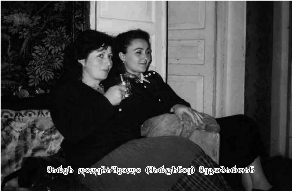
მხატვრის დიდებაში (მხატვრის) მეგობარებთან

მთაში ნიჭიერი ადამიანები ცხოვრობენ. უყვართ პროზა-პოეზია და, მიუხედავად ბევრი საქმისა და მძიმე შრომისა, თავადაც ძალიან ლამაზად წერენ. უმდიდრესია მათი შემოქმედების ჟანრი და თემატიკა. ბუნებრივად, სიხარულს, ტკივილს, უბედურებას – ყველაფერს ლექსად ამოთქვამენ.