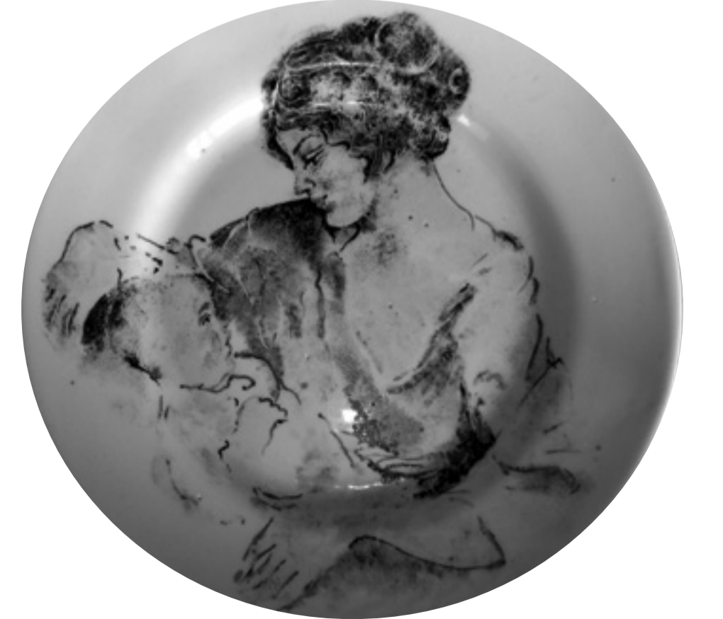
თამარ იორამაშვილის ნამუშევარი ფაიფურზე