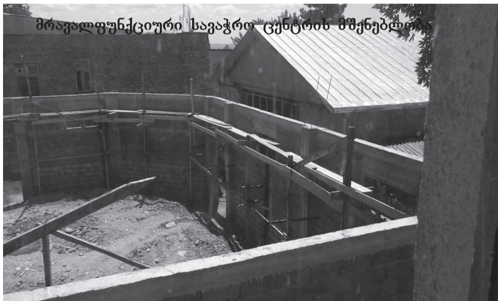
მრავალფუნქციური სავაჭრო ცენტრის მშენებლობა

ყოფილი გლეხური ბაზარი ეკუთვნოდა საგარეჯოს რაიკოპკავშირს, ირიცხებოდა მის ბალანსზე. როგორც ჩემთვის და საერთოდ, ჩვენთვის, მუნიციპალიტეტის ხელმძღვანელობისთვის გახდა ცნობილი, აღნიშნულ ორგანიზაციას – რაიკოპკავშირს ჰქონია საგადასახადო დავალიანება, რისი გადახდაც ვერ შეძლო და კანონის შესაბამისად, მოხდა მისი მემკვიდრის მიერ (ჩვენი მუნიციპალიტეტის ხელმძღვანელობასთან წერილობითი ან სიტყვიერი შეთანხმების გარეშე) აუქციონზე გატანა-გაყიდვა. მინდა ხაზი გა-