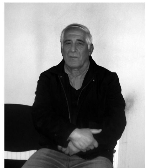
დაიბადა 1948 წელს სოფელ პატარძულში.

სოფლის მთლიანი ფართობი 14970 ჰა; სასოფლო-სამეურნეო სავარგულები 7409 ჰა; საძოვარი 4375 ჰა; სათიბი 99 ჰა; სახნავ-სათესი: 2667 ჰა; მრავალწლიანი ნარგავები: 268 ჰა; ვენახი 15 ჰა; საკარმიდამო ნაკვეთი: 137 ჰა; მოსახლეობა: კომლი – 1316 კაცი – 3516 სოციალურად დაუცველი – 433 ადამიანი. სოფლის ოფიციალური მთავრობის მეთაური