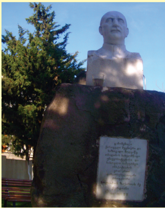
სოლომონ ქურდიანის ძეგლი

მე ვამაყობ, როცა მახსენდება, რომ გოგლა ლეონიძის და რევაზ ინანიშვილის თანამემამულე ვარ. მე არ ვიცი, ვის თავში მოიხარშა ეს აზრი – რაიონის ცენტრში დაედგათ ს. ქურდიანის ძეგლი. ეს ძეგლი მის სასაფლაოს უფრო დაამშვენებდა. ამასწინათ ერთი სამარცხვინო ფაქტიც