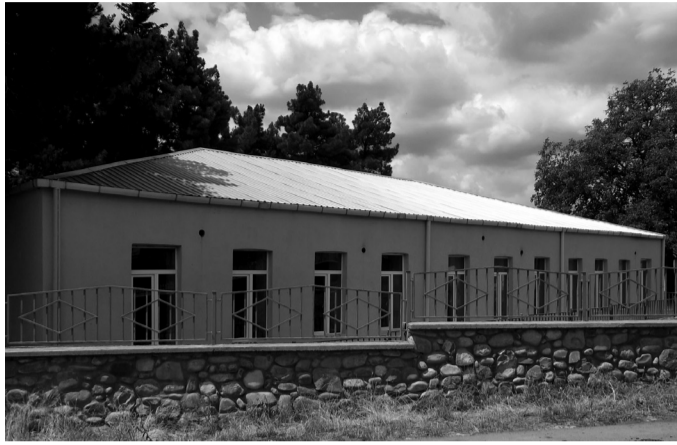
– კერძოდ, რომელი საჯარო სკოლები შევიდნენ ამ პროექტში და რა სახის სარეაბილიტაციო სამუშაოები შესრულდება თითოეულ მათგანში?

* იორმულანლოში ახალი სასკოლო კორპუსი ამოქმედდება * ლამბალოში 1015 მოსწავლეზე გათვლილი სკოლის მშენებლობა დაიწყება