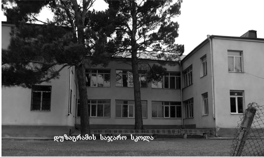
დუზაგრამის საჯარო სკოლა

– რა მდგომარეობაშია დუზაგრამის საჯარო სკოლის შენობა, საბავშვო ბაღი,