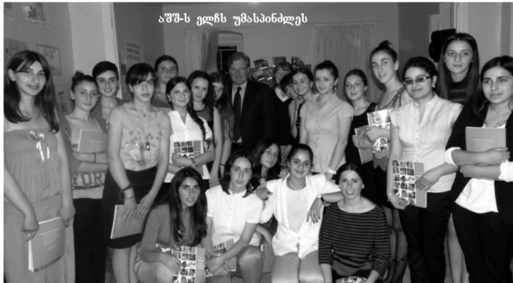
აშშ-ს ელჩის უმახსინძლეს