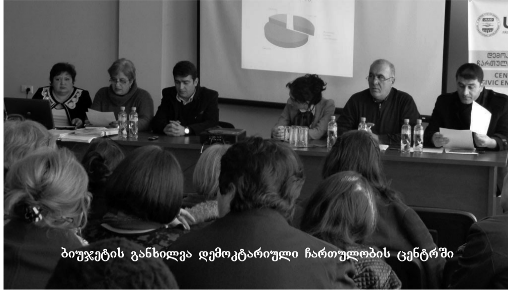
ბიუჯეტის განხილვა დემოკრატიული ჩართულობის ცენტრში