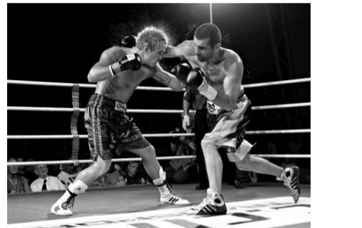
მენური იღვთები იხმარეს, თავები და იდაყვები გამოიყენეს.

ქალაქური კრივის ტრადიცია ფრანგენტილი გადმონაშთის სახით XX საუკუნის 60-70-იან წლებამდე შემორჩა და მას წინასწარ დათქმული გუნდური შეტაკებების ფორმა ჰქონდა, რომელიც წინასწარი მოლაპარაკების საფუძველზე იმართებოდა „ნადიკურის“ ტერმინითა (ქ. თელავის პარკი). ერთმანეთს უპირისპირდებოდა „ხემო“ და „ქვემო“ უბანი, ანუ ღვთაების ტაძრის გარშემო არსებული დასახლება და რომელიმე საცხოვრებელი კვარტალი. ასეთი დაპირისპირების მიზეზი არასოდეს გამხდარა რაიმე კერძო შემთხვევა. ბრძოლა ყოველთვის მხოლოდ და მხოლოდ შეჯიბრის სახე ჰქონდა და ძლიერი უბნის გამოსაჯენად ეწყობოდა. როგორც ჩანს, ძველი წესების გავლენით ჩხუბს ყოველთვის აწვევდნენ 8-10 წლის ბიჭებს და მხოლოდ შემდეგ ჩაებმებოდნენ ხოლმე ბრძოლაში მოზრდილები. თუმცა არ ახსოვთ შემთხვევა, რომ ბრძოლაში მონაწილეობა 18 წელზე უფროსი ასაკის ახალგაზრდებს მიეღო.