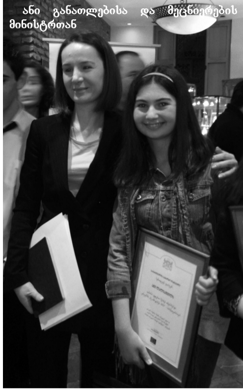
ანი განათლებისა და მეცნიერების მინისტრთან