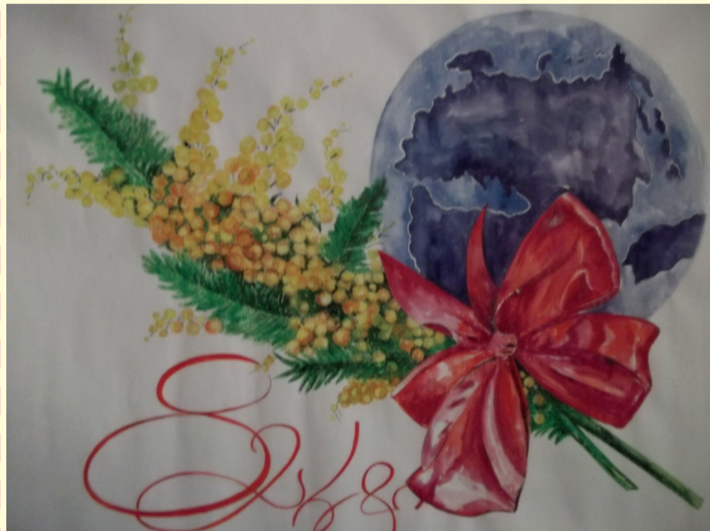
თამილა ჯოხაძის ნახატი

აიპ „საგარეჯოს სკოლამდელი აღზრდის დაწესებულებათა გაერთიანების ხელმძღვანელობა“