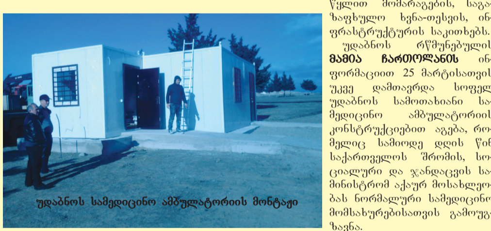
უდაბნოს სამედიცინო ამბულატორიის მონტაჟი

თათბირზე საუბარი შეეხო 21 მარტს გრიგალით ჩვენი მუნიციპალიტეტისათვის მიყენებულ ზარალს. ასევე, საუბარი შეეხო ცალკეული სოფლების მოსახლეობის სასმელი წყლით მომარაგების, საგაზაფხულო ხენა-თესვის, ინფრასტრუქტურის საკითხებს.