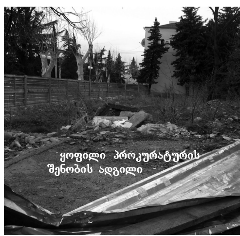
ყოფილი პროკურატურის შენობის ადგილი