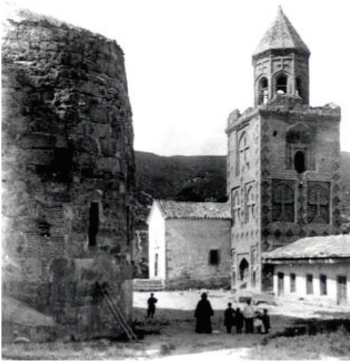
ფოტო ეკუთვნის საქართველოში პირველ პროფესიონალ ფოტოგრაფს ალ. როინაშვილის. (1846-1898 წწ). ფოტო მოკოვებულია ფოტოფრაფიის მუზეუმიდან და რომლის გადაღების თარიღი დადგენილი არ არის

კულტურული ცხოვრების მაჯისცემა. ნინოწმინდის დიდებული ტაძარი 1824 წელს მომხდარმა მიწისძვრამ და უდიდესმა ქარიშხალმა შეძრა. ათასწლოვანმა კედლებმა ვეღარ შეიმაგრა დიდი ტვირთი და თალი და გუმბათი ჩამოიქცა ზათქითა და გრიალით. 1848 წელს კი სტიქიამ სხვა კედლებიც დაანგრია.