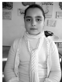
წმინდა მოღვაწეზოზილი – საგარეულოს I საჯარო სკოლის V კლასის მოსწავლე.