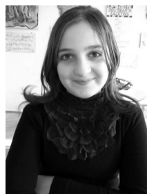
წმინდა ბატონი – საგარეულოს I საჯარო სკოლის VII კლასის მოსწავლე;