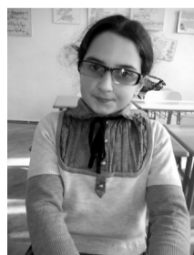
წმინდა ალუაზოზილი – საგარეულოს I საჯარო სკოლის V კლასის მოსწავლე;