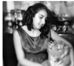
წმინდა ბუზარიაზოზილი – საგარეულოს III საჯარო სკოლის VII კლასის მოსწავლე;