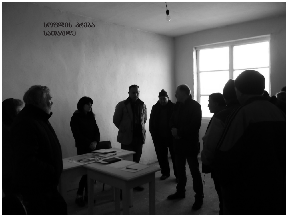
სოფლის კრება სათაფლზე

სადაც გადავიტანთ ე.წ. აგრარულ ბაზარს. აქ გამოიყოფა ადგილი გარემოვაჭრების განსათავსებლად. მდინარე თვალთხევის მარცხენა სანაპიროზე, თამარ მეფის ქუჩაზე მოხდება კედლის ამაღლება, აქ განთავსდება მოვაჭრეთათვის დახლები, ე.წ. ფარდულები. მომხმარებელსაც და მოვაჭრესაც გაუადვილებს იქ მისვლა, აღარ იქნება ავტომანქანებისგან შექმნილი ხელოვნური საცობები ღვესელიძისა და ერეკლე II-ის გადაკვეთაზე და ქვეითადმოსიარულეებსაც საშუალება ექნებათ თავისუფლად ისარგებლონ კეთილმოწყობილი ტროტუარით.