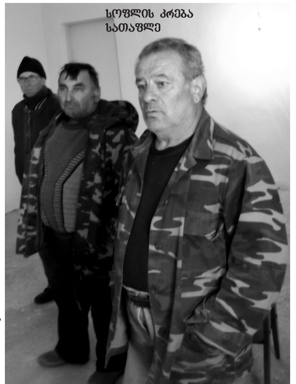
სოფლის კრება სათაფლზე

– არ ახალია, თუ ვიტყვით, რომ თვითონ მოსახლეობაც უყარათოდ ექცევა სასმელ წყალს. დავიწყოთ იქიდან, რომ წლების განმავლობაში უმთავრად გაიხეხა ტყეები, რამაც წყლის დებეტის შემცირება გამოიწვია. სოფლებში, ცალკეულ უბნებში დაყენებულია საუნბო ონკანები, რომლებიც მოშვებულია და წყალი უსარგებლოდ იღვრება, ან ოჯახებს უნებართვოდ აქვთ შეყვანილი სახლებში. ჩვენი მუნიციპალიტეტის გამგეობის ზედამხედველობის სამსახურმა ასეთებს გაუუქმა თვითნებური გაყვანილობა და აუკრძალა კანონიერად, მაგრამ... მიმდინარე წელს დაიწყება ქ. საგარეუროში სასმელი წყლის ახალი გაყვანილობის სამუშაოები, მოსაწყობია სასმელი წყლის ჭაბურღილები. ასე, მაგალითად, დღის წესრიგში მწვავედ დგას სოფელ წყაროსთაში და ე.წ. „ჭარღების უბანში“ ჭაბურღილის მოწყობის საკითხი. განსაკუთრებულ მზრუნველობას ითხოვს ჩვენი მუნიციპალიტეტში სოფლების ტერიტორიაზე არსებული სათავე-ნაგებობების რეზერვუარების შიდასაუნბო და ცენტრალური ქსელების, სატუმბო სადგურების მოვლა-პატრონობა და რეცხვა-დუზინფექცია სადუზინფექციო საშუალებებით, რათა