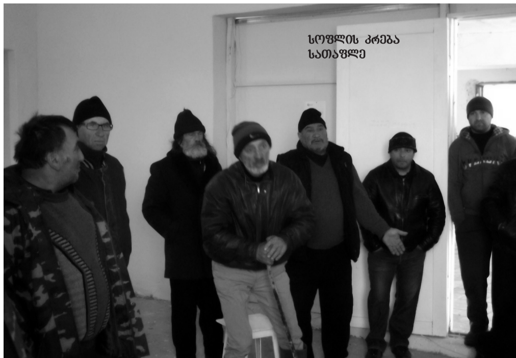
სოფლის კრება სათაფლზე

– დამეთანხმებით, სოფლის მეურნეობის ყველა დარგის განვითარება ჩვენთან შესაძლებელია, ჩვენი მუნიციპალიტეტის ხელმძღვანელობა ყველანაირად ამოუვლავებთ მხარში ინდუსტრიული ტექნოლოგიების დანერგვას. ბოლო პერიოდში ინტერესი დიდია მეფუტკრეობის განვითარებისათვის, რასაც ჩვენ სრულ მხ-