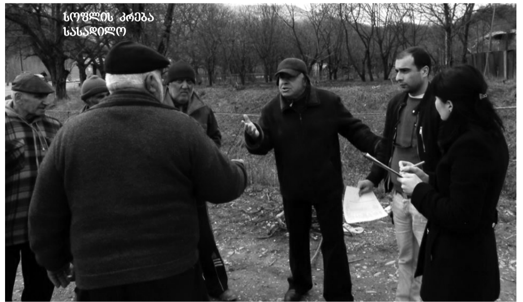
სოფლის კრება სასადილო