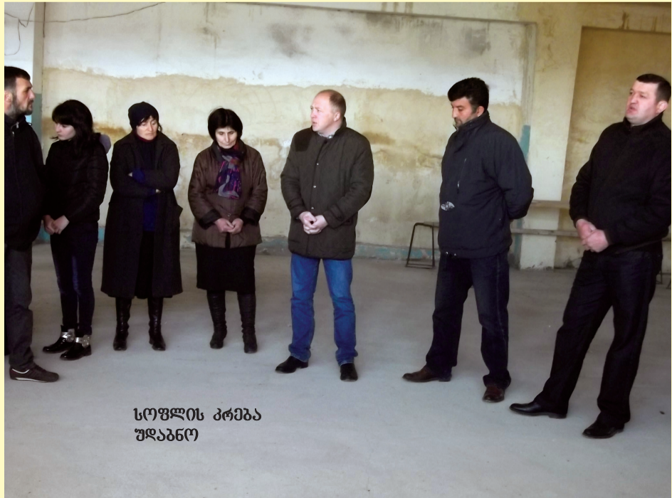
სოფლის კრება უდაბნო