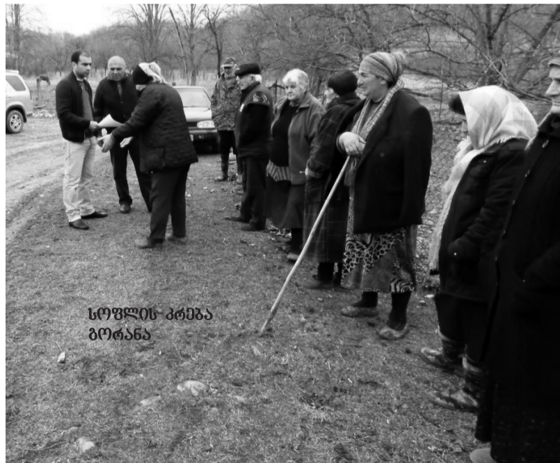
სოფლის კრება გორანა

23 მარტს სოფელ სათაფლეში გამართულ სოფლის კრებაზე აქაურ მოსახლეობას საგარეჯოს მუნიციპალიტეტის გამგე-