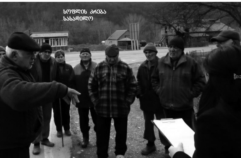
სოფლის კრება სასადილო

სოფლის კრებაზე მოსულმა სოფლის მცხოვრებლებმა გადაწყვიტეს „სოფლის მხარდაჭერის“ პროგრამის ფარგლებში გამოყოფილი თანხის 1743 ლარი კვლავ საბავშვო ბაღის კეთილმოწყობას მიუხმარონ.