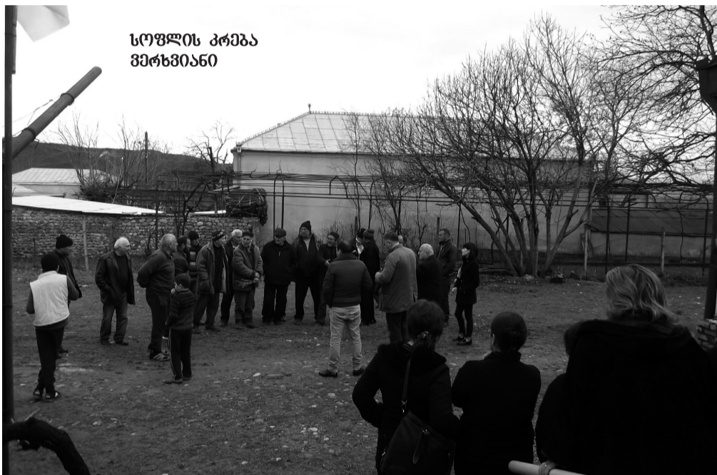
სოფლის კრება მერხვიანო

სოფელი, რომელშიც ეკომიგრანტები 1987 წლიდან ცხოვრობენ უკანასკნელი ათეული წლების განმავლობაში უწყობლობას განიცდის. ის 35 კმ-იანი წყალსადენი,