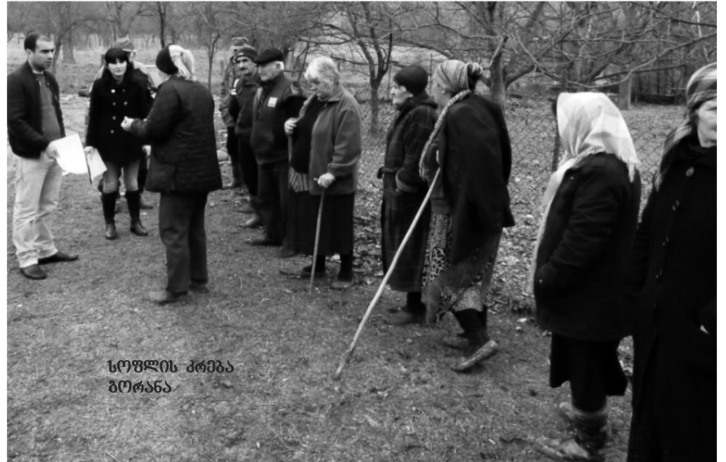
სოფლის კრება გორანა