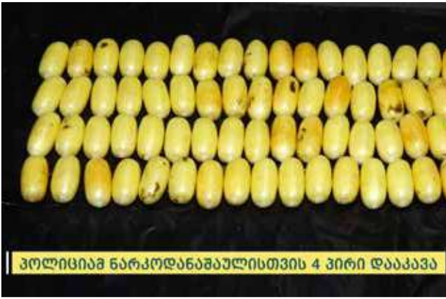
პოლიციამ ნარკოდანაშაულისთვის 4 პირი დააკავა

შინაგან საქმეთა სამინისტროს ცენტრალური კრიმინალური პოლიციის დეპარტამენტის თანამშრომლებმა, ინტენსიურ რეჟიმში ჩატარებული კომპლექსური ოპერატიულ-სამძებრო და საგამოძიებო ღონისძიებების შედეგად, თბილისში ნარკოდანაშაულისთვის ოთხი პირი დააკავეს. დანაშაულები 20 წლამდე ან უვადო თავისუფლების აღკვეთას ითვალისწინებს.